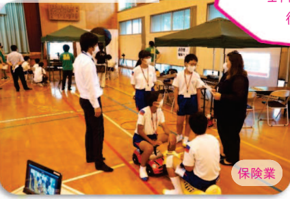
水平器を用いた作業は、初めての経験で、難しかったがとても貴重な体験になった。