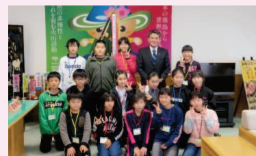
「霧島市のリーダーと」

目的：職業人の講話や体験活動を通して、小学生が自身の将来について考え、「志」を立てることを目的とした事業です。