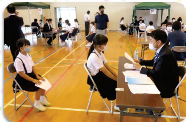
たくさん褒めてもらって、やる気スイッチON！

児童が将来の夢や、今頑張っていることを熱心に話してくれました。そして、未来のために今が大切だということを学んでいる様子を見て、私たち大人も仕事に対して改めて考えるいい機会になりました。