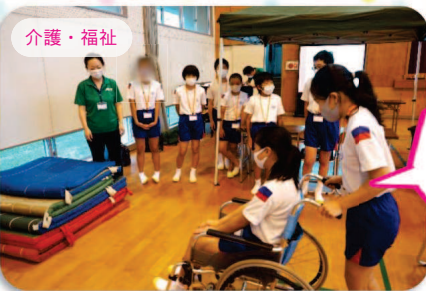
「おにぎり」1つ握るでも大変だということ学びました。

7つのブースに分かれ、「職業体験」を行いました。どの体験ブースも「本気」モード！仕事にける熱い思いを感じるとともに、実際に体験することで、職業への理解を深め、夢を育む機会となりました。