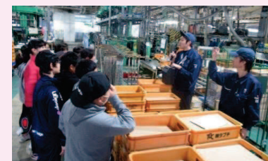
「霧島の企業で働く」