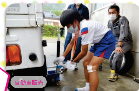
タイヤ交換も、自転車販売にとって大事な仕事です。