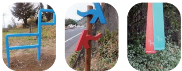
▲赤と青のリボンや矢印、馬の形をしたカンセを目印に進もう。カンセは馬の頭が進行方向

☎ 0995-45-5111 (霧島市観光 PR 課) ☎ 0995-78-2115 (霧島市観光協会) 巻末 Map④-4