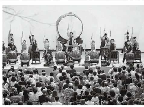
神楽や太鼓を披露する天孫降臨霧島祭が8月19・20日に霧島神宮社務所前広場で開催。県内外から集まった団体がステージを盛り上げ、来場者数は2日間で2千人を超えました。