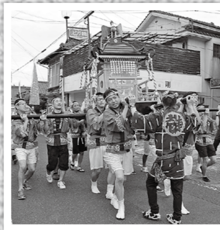
隼人町日当山地区の若手グループ「ひなたやま華たれ会」が公民館に眠っていたみこしを30年ぶりに復活。8月26日のひなたやま夏祭りで地区内を担いで練り歩きました。←