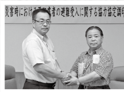
災害時における要配慮者の避難受入に関する協力協定調印