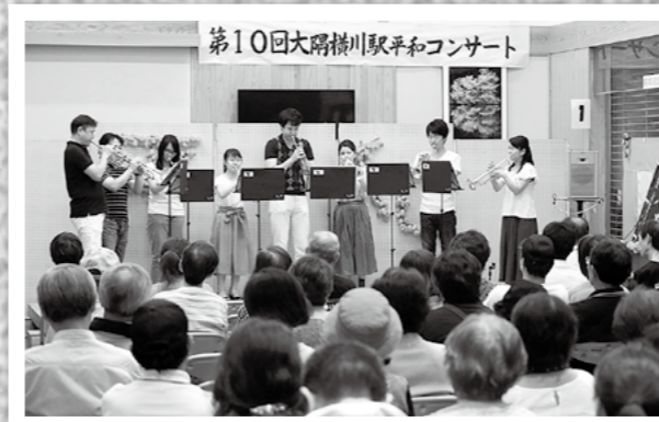
↑第10回大隅横川駅平和コンサートが7月30日、横川総合支所であり、地元の児童や霧島国際音楽祭の講師、受講生による演奏がありました。