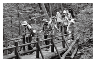
↑森で過ごす癒しの休日in霧島が7月30日、牧園町の丸尾自然探勝路であり、参加者は樹木に触れたり匂いを嗅いだりして自然を満喫しました。