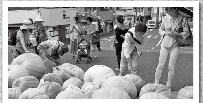
カボチャの重量を競う第5回ビッグパンプキン重量コンテストが8月27日、大隅横川駅で開催。49個が出品され、最も重いカボチャは91.6kgでした。↓