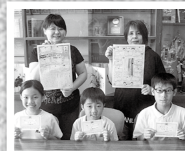
←キリシマイスター活動に取り組む溝辺小学校PTAが7月19日、親子の絆をテーマに作成したPTA新聞を初めて発行。児童と保護者が互いに褒めたいところを記入したカード200枚から選ばれた24枚を紹介しました。