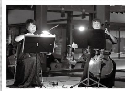
←隼人町の神宮通り会の主催で第1回天の川コンサートが8月7日、鹿児島神宮の拝殿であり、厳かな雰囲気の中、参加者はクラシックなどの音楽に聴き入りました。