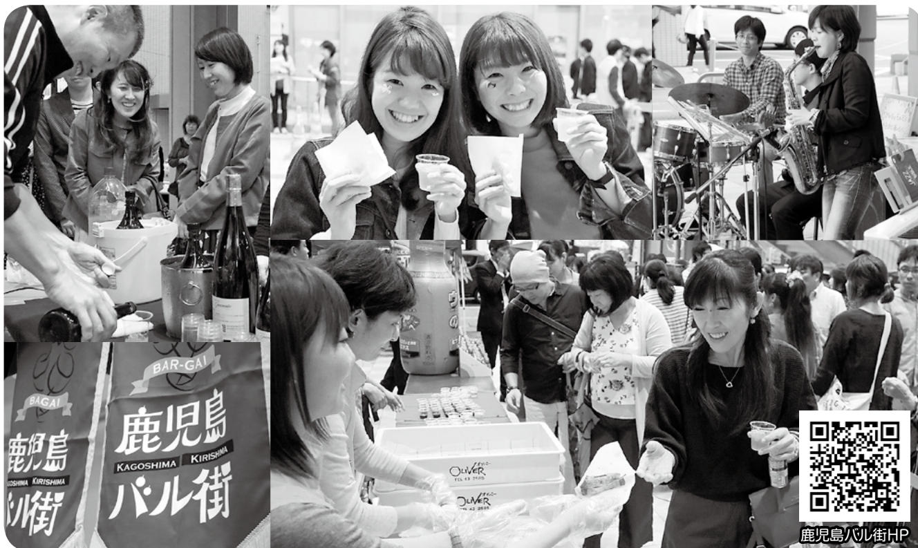
昨年のオープニングイベントの様子。今年もドリンクの振る舞いやジャズ演奏を実施