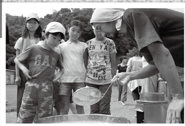
↑塩分を濃縮した海水を天日干しや釜でたいて塩を作る親子塩づくり教室が7月21日、牧園町の持松小学校でありました。