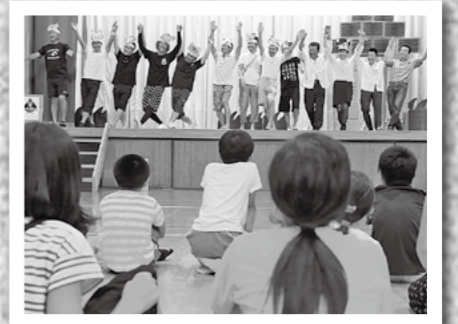
夏休みの思い出を作ってもらおうと8月18日、横川町の安良小学校で父親やOBらが絵本創作劇を子どもたちに披露しました。→