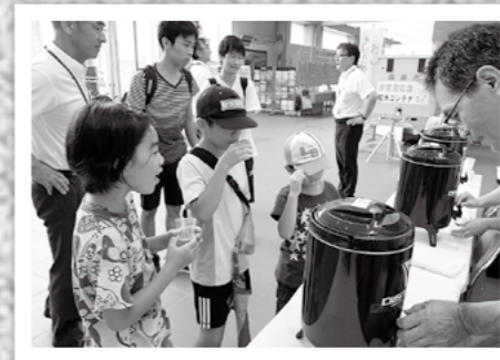
←霧島市の水道水のおいしさや供給の仕組みなどを紹介・実演する水フェスタが8月4日、国分シビックセンターでありました。