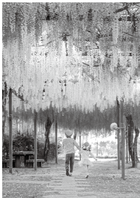
↑きりしま大賞「和気藤の誘い」