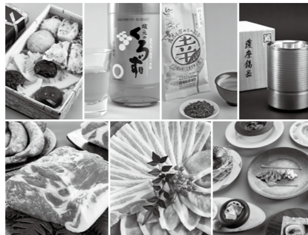
星7つの認定産品(産品・サービス部門)。詳細は市ホームページで紹介。