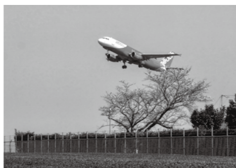
↑エアポート大賞「旅立ちの季節」

「第15回きりしまフォトコンテスト」の審査会が1月31日に実施され、488点の応募の中から大賞や優秀作品など46点が選ばれました。同コンテストには自由部門とエアポート部門があります。応募数は、霧島市の四季に富んだ自然風景、伝統行事、環境、ジオパークなどに関するものを写した自由部門に103人から274点、飛行機や空港で働く人々、出会い、別れなど鹿児島空港の魅力を写したエアポート部門に92人から214点の応募がありました。