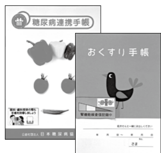
お薬手帳と糖尿病連携手帳

年に一度は健診を受け、健康管理に努めましょう。 ☎1178 ☎(42)1178 問IIすこやか保健センター