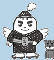
選挙啓発キャラクター めいすいどん