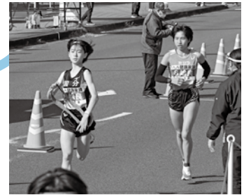
思いを込めたたすきをつなく(昨年度)