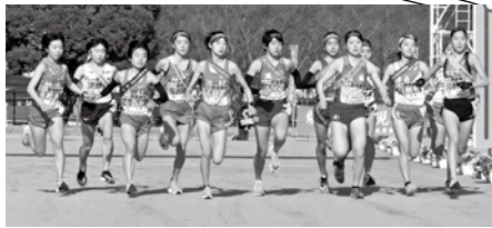
一斉にスタートする県内12地区のランナー(昨年度)