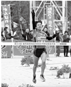
3連覇を達成したゴールの瞬間 (昨年度)