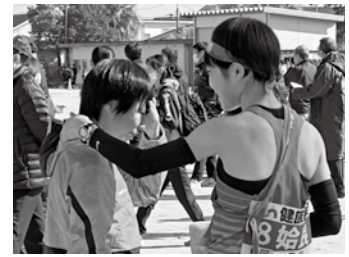
4連覇を逃し、涙を見せるランナー (昨年度)