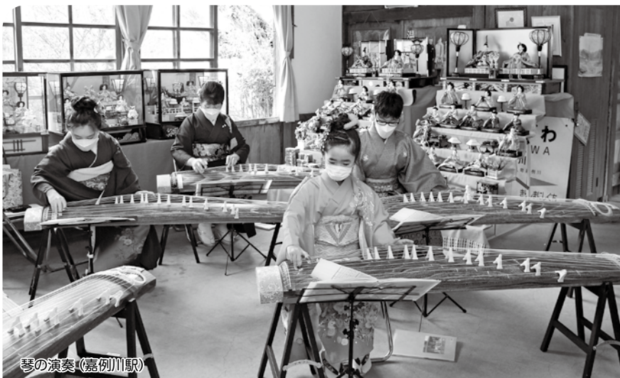
琴の演奏(嘉例川駅)