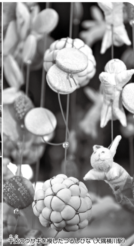
干支のウサギを模したつるしびな(大隅横川駅)