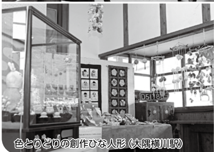
色とりどりの創作ひな人形(大隅横川駅)