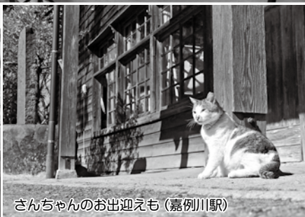
さんちゃんのお出迎も(嘉例川駅)