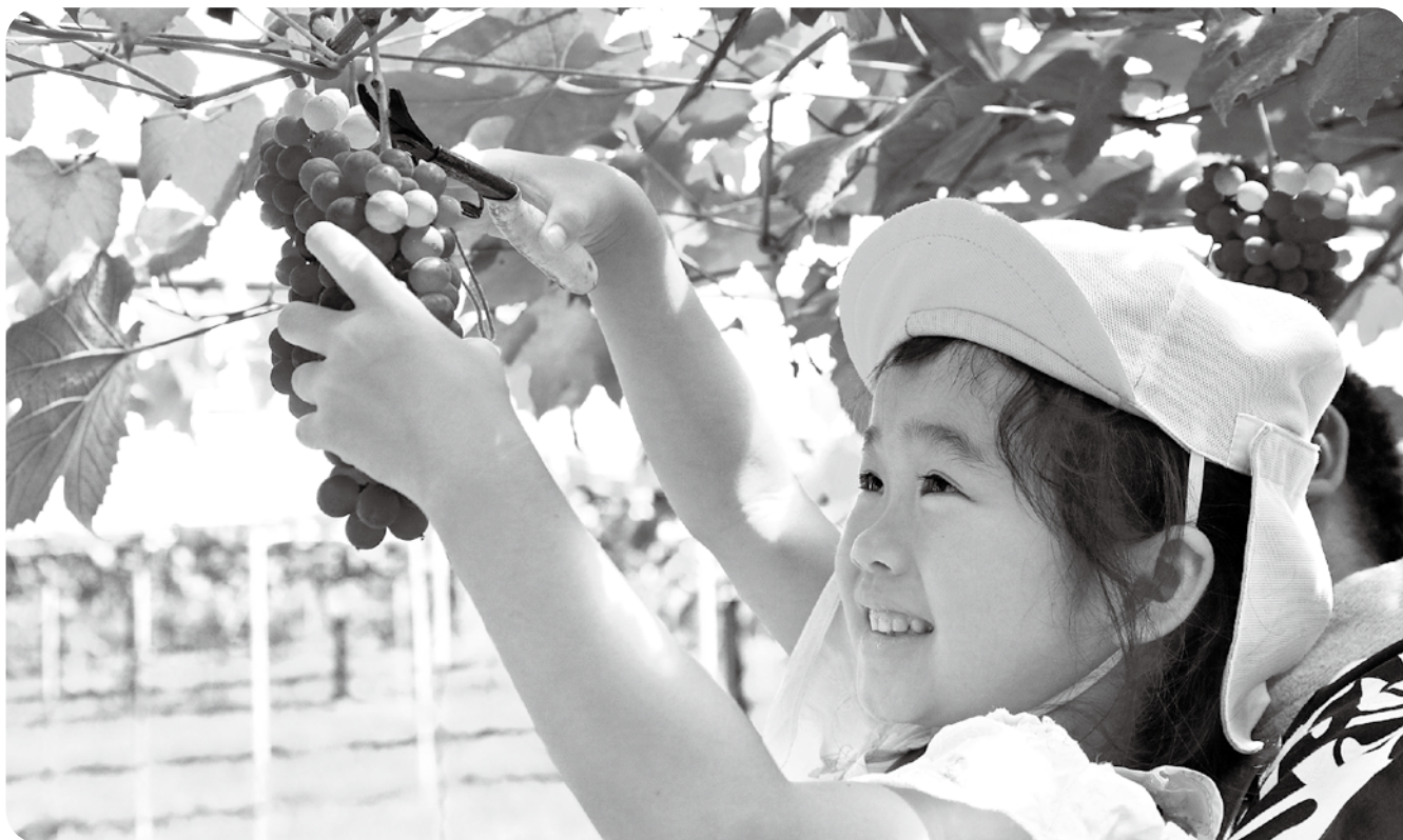
ブドウ狩りの様子 (竹子フルーツ)