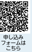
申し込みフォームはこちら