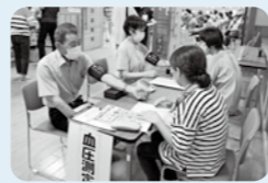
検診会場での血圧測定

を控えてみた」との言葉がとてもうれしいです。自宅で血圧を測り始めてまだ数年ですが、朝同じ時間に測ることで、体調の変化が分かるようになりました。皆さんも日常生活の中に、血圧測定を取り入れてみませんか。