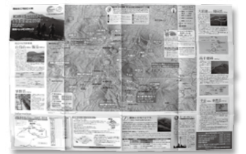
登山の注意や立ち入り禁止区域などが載ったトレッキングマップ。高千穂河原ビジターセンターとえびのエコミュージアムセンターに設置。

秋本番、霧島山の紅葉が色づき始めるこの時期は、多くの登山客が訪れます。しかし霧島山は現在も活動を続けている活火山。3年9か月前に噴火した新燃岳は、噴火警戒レベル2で、今も火口から1kmは立ち入り禁止。登山道では、約2kmで立ち入り規制をしています。安心して登山を楽しむためには、一人一人の心構えが必要です。