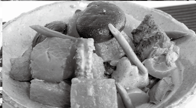
会場には霧島の食文化がすなり