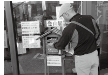
登山口などに設置されている登山届けボックス。必ず届けを出してから登山してください。