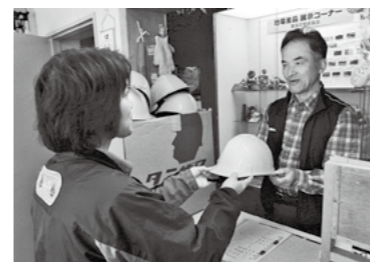
高千穂河原ビジターセンターではヘルメットの貸し出しを始めました。ご希望の方は受付に申し込みください。