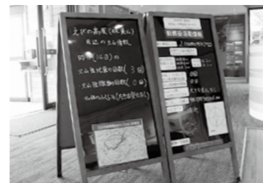
高千穂河原ビジターセンターとえびのエコミュージアムセンターには火山情報などが紹介されています。

情報収集が大切 高千穂河原ビジターセンターやえびのエコミュージアムセンターで最新の登山情報を収集してください。