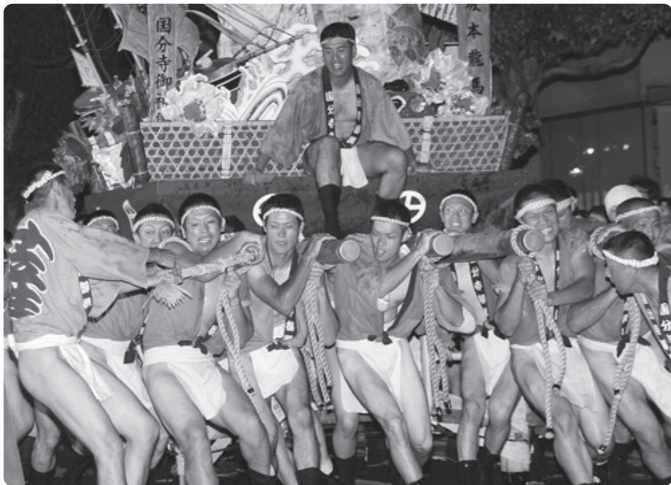
迫力ある「国分寺御輿競争」(昨年の霧島国分夏まつり)