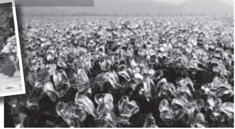
3月11日、氷の粒に覆われた溝辺地区の茶畑