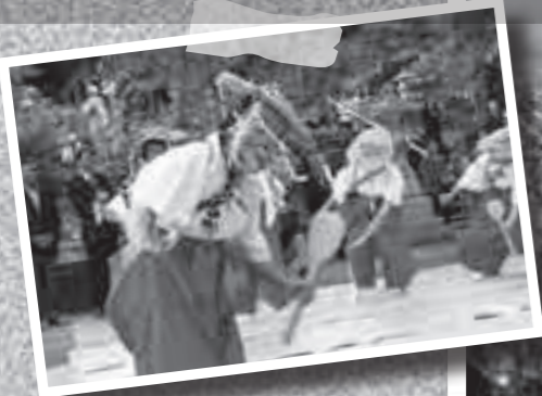
3月1日、天御中主(北辰)神社大祭。女性だけで田の神舞を披露(国分清水地区)