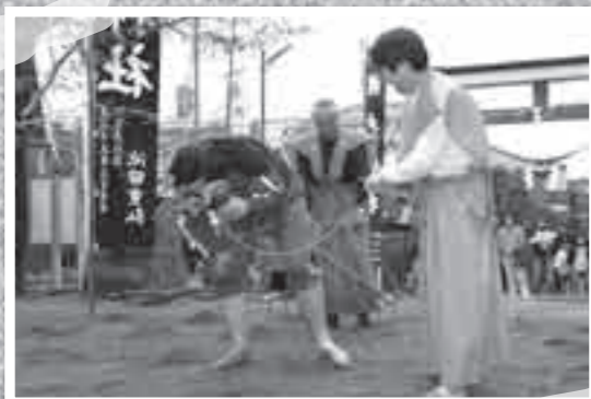
3月7日、国分府中の祓戸神社で行われた春祭り。別名「牛の砂かけ祭り」といわれる伝統のお祭り