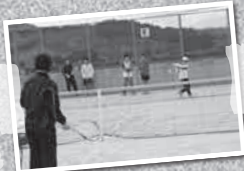
今年初めて霧島市でキャンプをした園田女子大学テニス部が、小・中学生にテニス教室を開催