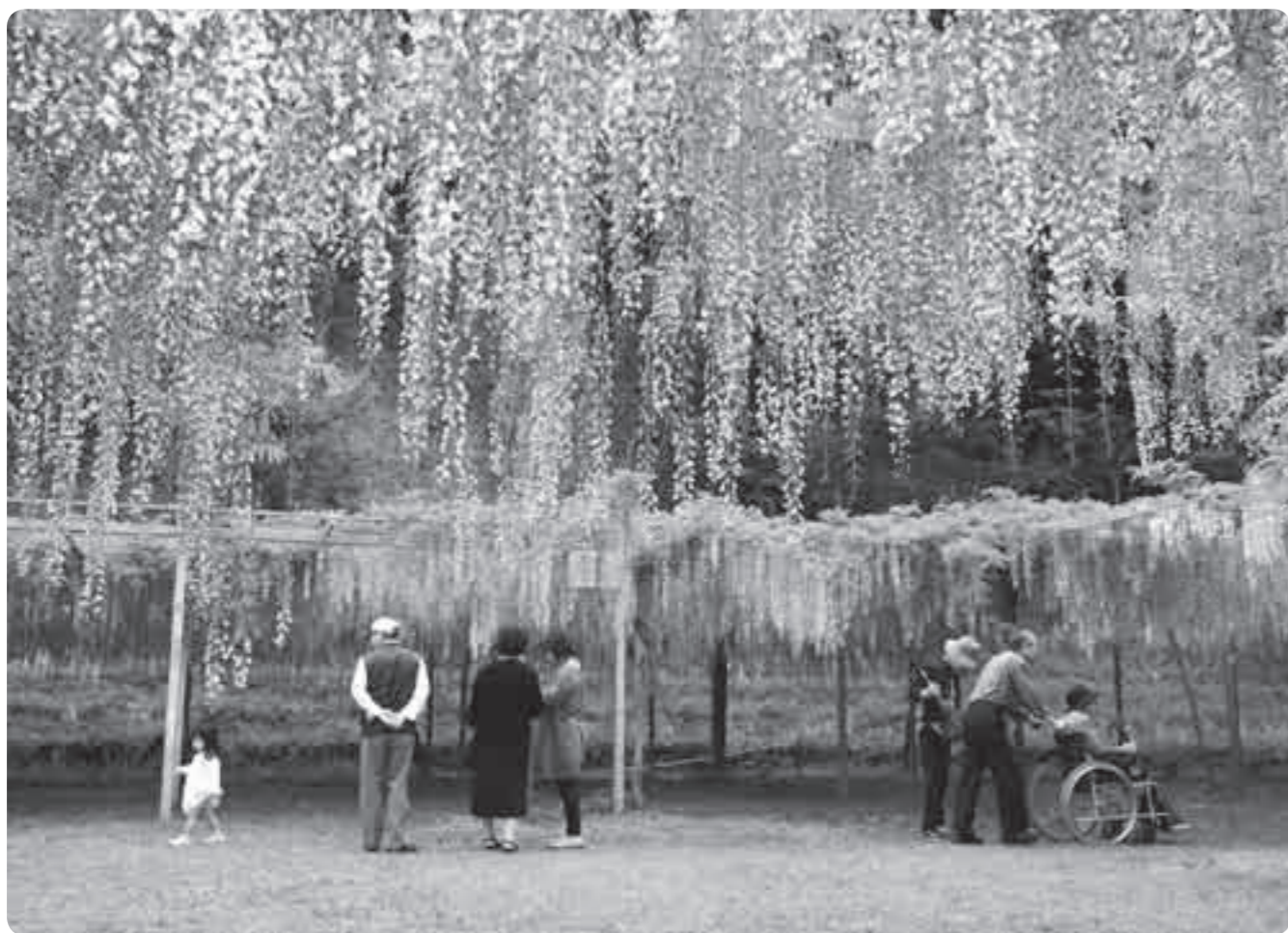
昨年の藤まつりフォトコンテスト作品:「香りに誘われて」