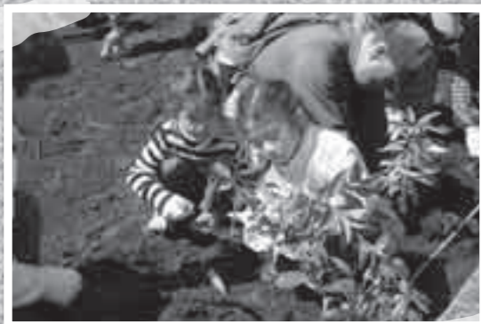
2月28日、牧園地区で霧島ふるさと命の森をつくる会が植樹会