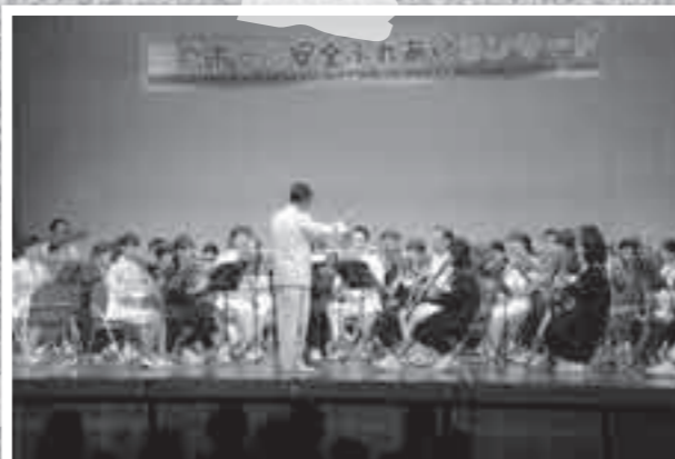
3月6日、初めて開催された「霧島市安心安全ふれあいコンサート」(霧島警察署主催)