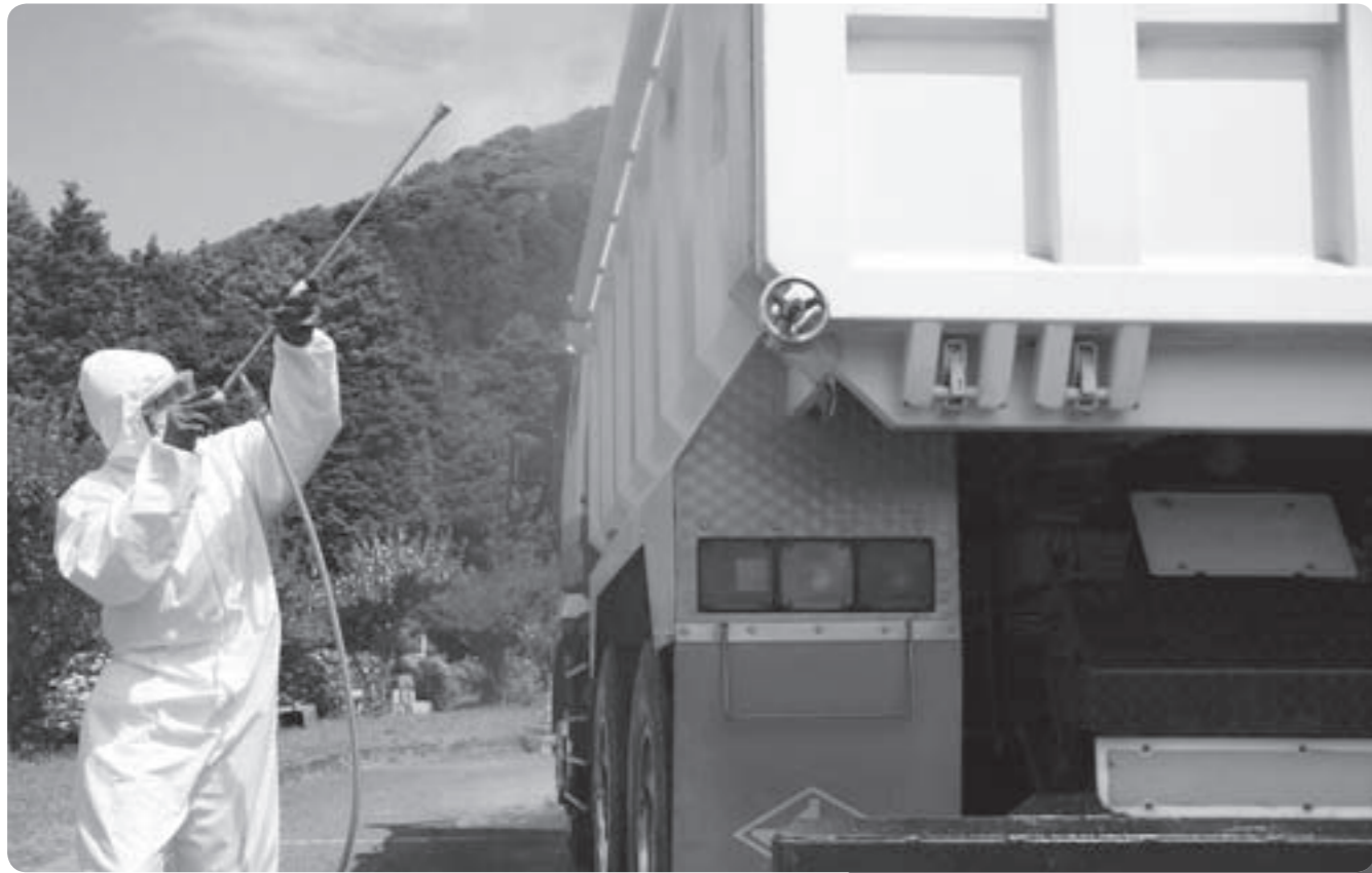
連日、懸命な消毒活動が実施されています