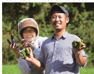
移住定住促進補助事業 (移住者への支援)