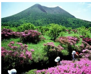
環境基本計画 策定・進行管理事業