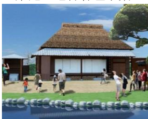
市内各種観光施設維持管理 総務事業(「西郷どんの宿」)