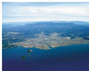
生活排水対策推進計画 策定及び進行管理事業