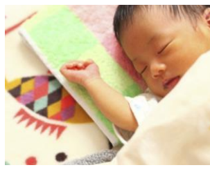
粉ミルク支給事業