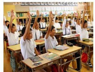
小学校学校施設整備事業