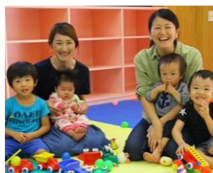
特定不妊治療費 助成交付事業