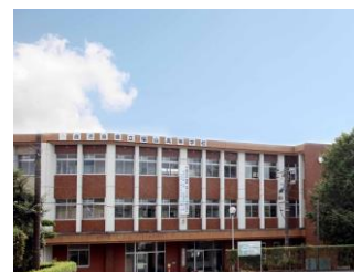
県立福山高等学校 通学費等支援事業