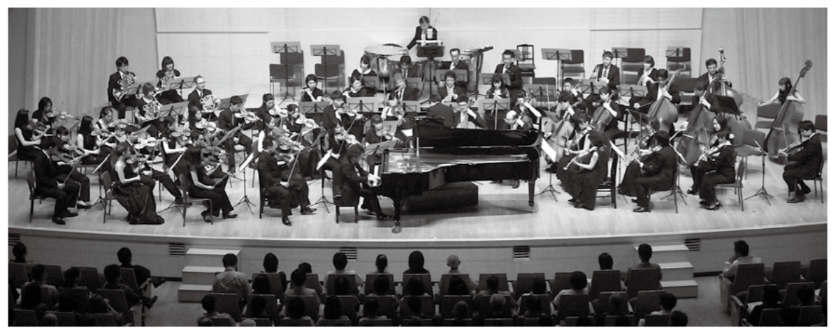
霧島国際音楽祭のファイナルコンサートが8月5日、みやまコンセールで開催され、素晴らしい演奏に大勢の観客が酔いしれました。