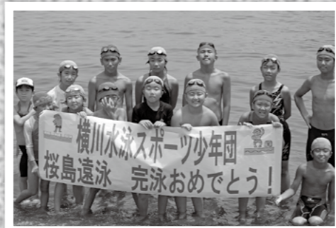
横川水泳スポーツ少年団14人が7月29日、桜島から磯海水浴場までの4.2kmを遠泳しました。