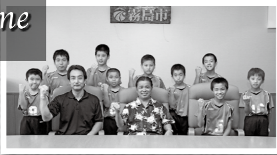
ファミリーマートカップ第32回全日本バレーボール小学生大会鹿児島大会(男子の部)でつばさJrバレーボールスポーツ少年団が3位になりました。