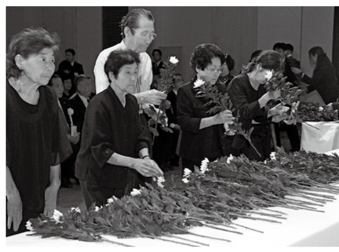
↑ 霧島市戦没者追悼式が8月3日、国分シビックセンター多目的ホールで開かれ、222人の参列者が戦没者の慰霊を慰めました。