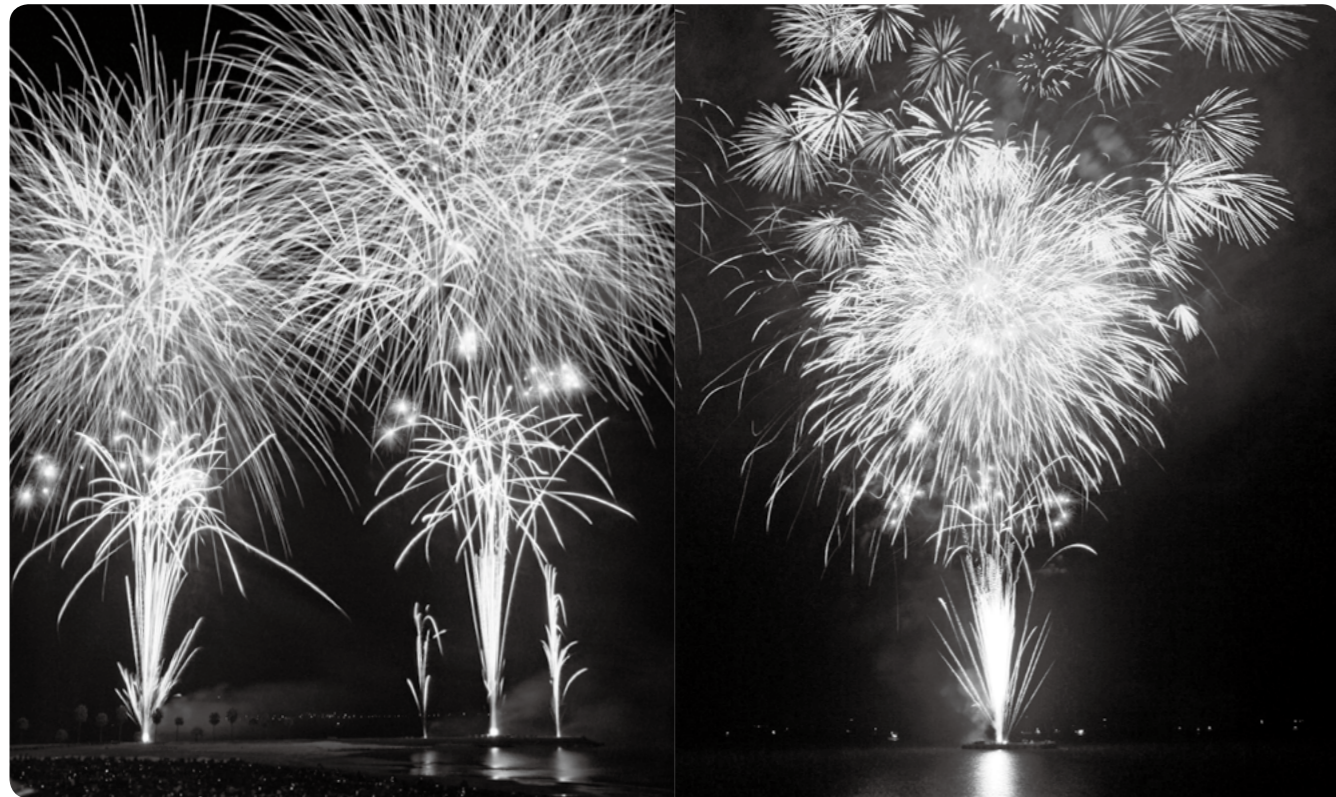
一昨年開催された花火大会の様子