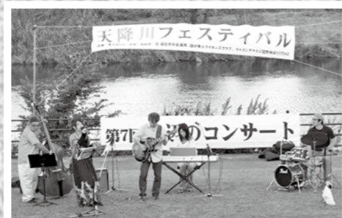
隼人宮内会による天降川フェスティバルが8月25日に開催され、多くの参加者が遊覧船や水辺のコンサートを楽しみました