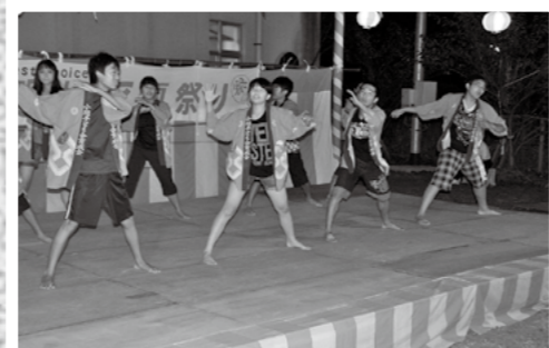
福山町小廻地区で8月19日、夏祭りが行われ地元の小中学生の合唱や花火の打ち上げなどがあり、大勢の観客でにぎわいました。