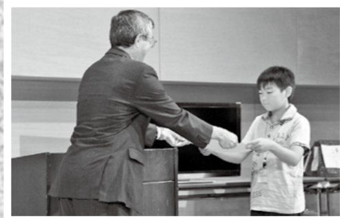
市内の風景や行事などを絵画にした「地域のたから」自慢絵画コンテストの表彰式が9月1日、国分シビックセンターであり14人が表彰されました。