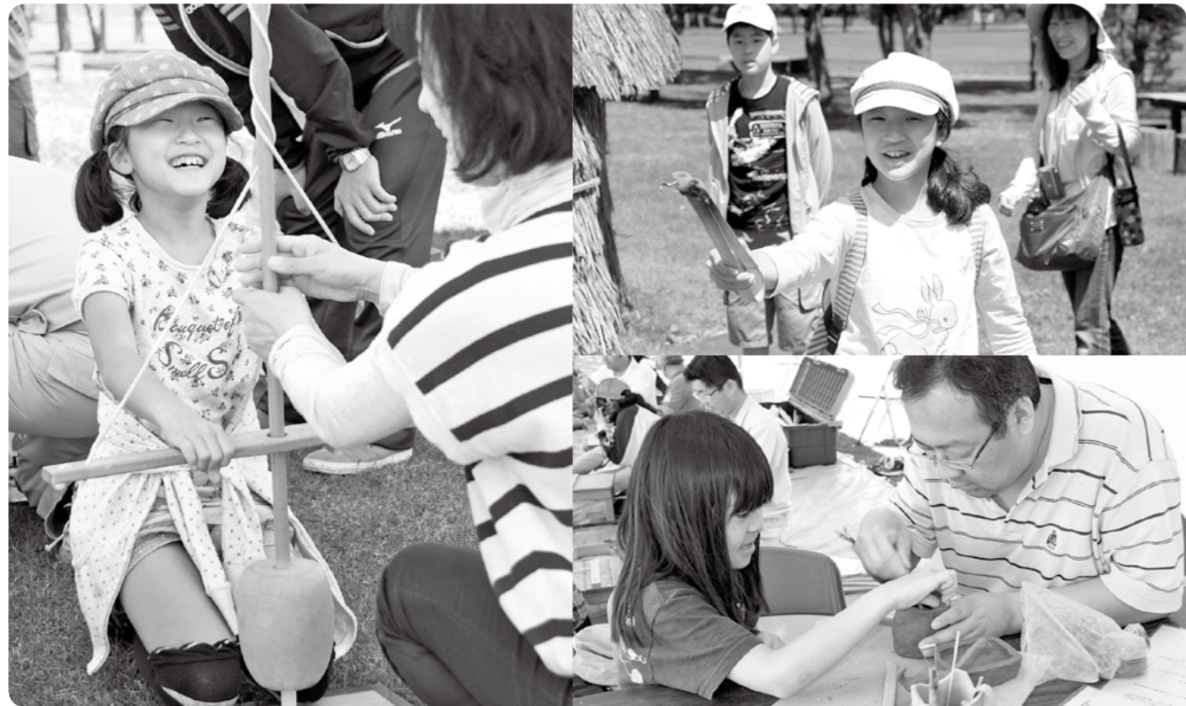
今年の春まつりの様子。秋まつりでも子どもから大人まで楽しめる催しがたくさん