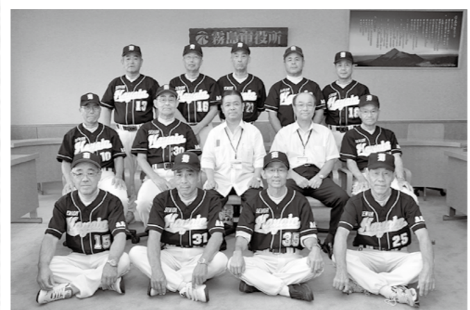
全日本シニアソフトボール大会の県予選で優勝した隼人シニアが市役所を訪問。9月28日からの全国大会に出場します。