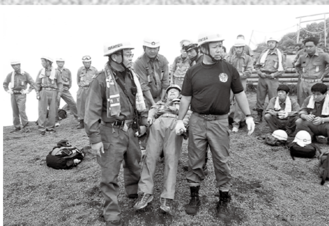
9月2日、防災週間に合わせて市内各地で全消防団員が訓練を実施しました。