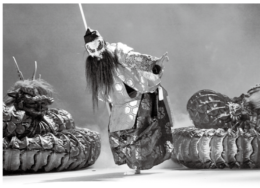
天孫降臨霧島祭が8月25日、26日の2日間、霧島神宮やみやまコンセールで開催され、小学生からプロまでの太鼓演奏や神楽の披露などがありました。