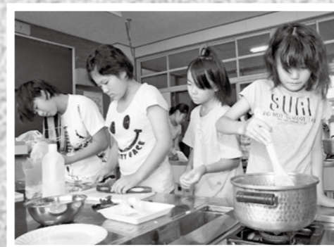
子どもたちがさまざまな体験を通じて自主性を養う「万膳学寮」が8月29日から5日間開かれ、小中学生11人が参加しました。