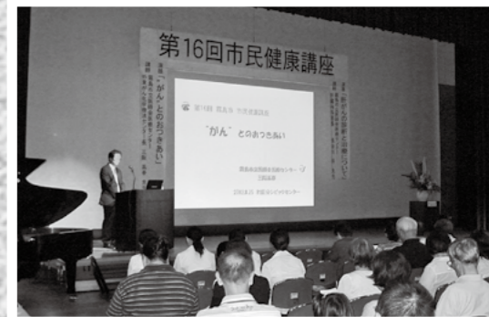
「がんとのおつきあい」「肝がんの診断と治療について」の内容で8月25日、国分シビックセンターで市民健康講座が開催され、市民や医療関係者などが参加しました。