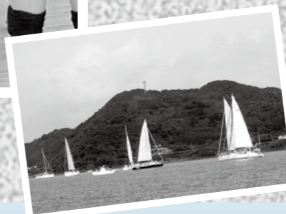
県内在住の外国人との交流を目的とした、国際親善レガッタ(ヨットレース)が9月2日、錦江湾でありました。