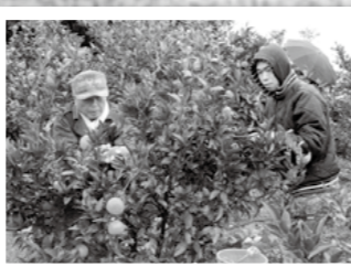
エコミュージアム福山が開催するみかん狩りが12月2日、福山のみかん畑でありました。