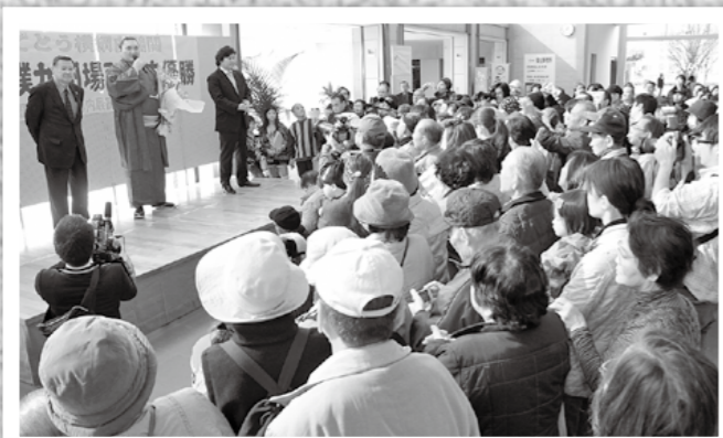
大相撲九州場所6連覇した横綱白鵬関が11月28日、市役所を表敬訪問。今回で市訪問は8年連続で、約500人の市民らが大きな拍手で出迎えました。