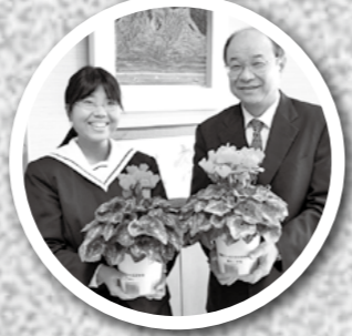
国分中央高校園芸工学科の3年生14人が育てたシクラメンを市役所に寄贈。同校では一鉢800円で販売しています。