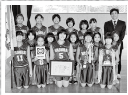
県下ミニバスケットボール選手権大会で安良ミニバスケットボールクラブが3位になりました。