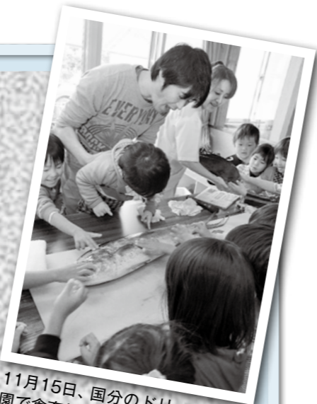
11月15日、国分のドリーム保育園で食育教室があり、松元鮮魚の方がシイラを目の前でさばき、子どもたちは興味津々の様子でした。