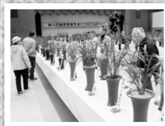
薩摩寒蘭鹿児島県連合展示大会が11月16日から3日間、溝辺体育館であり、328鉢が展示されました。