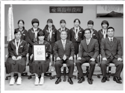
県中学新人ソフトテニス大会で陵南中学校が優勝し11月22日、市役所を表敬訪問しました。