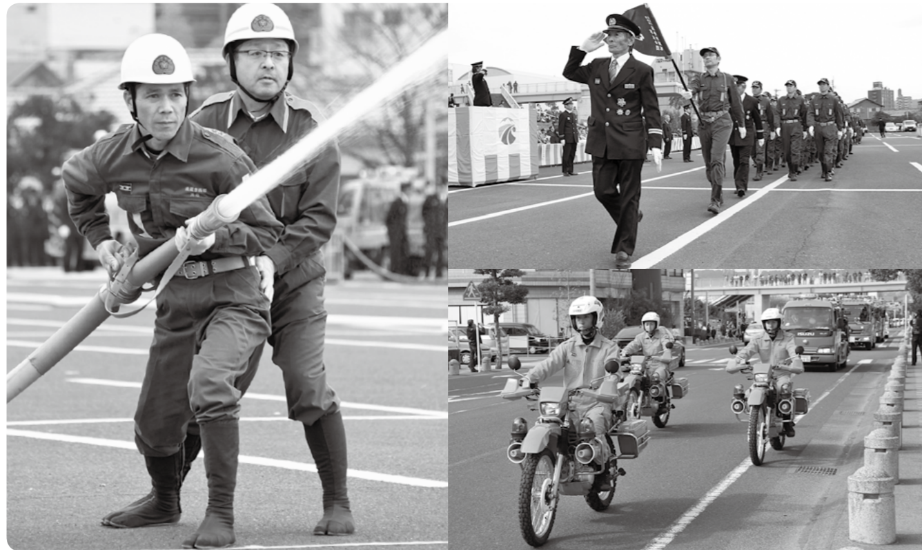
昨年開催された消防出初式