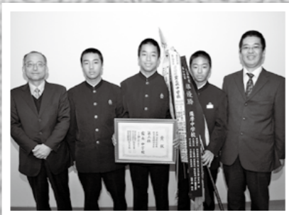
県下中学校秋季選抜野球大会で霧島中学校野球部が準優勝し11月19日、市役所を表敬訪問しました。