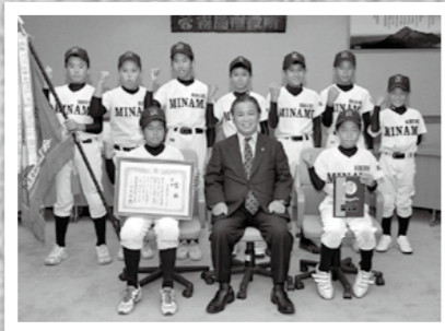
県小学童選抜軟式野球秋季大会で国分南軟式野球スポーツ少年団が優勝し11月19日、市役所を表敬訪問しました。