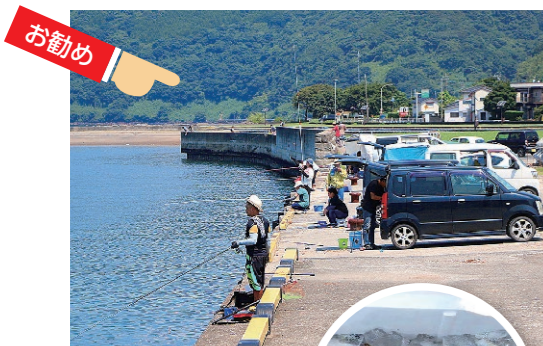
↑魚釣りを楽しむ人たち

駐車場も広く、近くにはトイレもあるのでとても便利。釣り好きな人はぜひ福山港周辺へ行ってみてください。