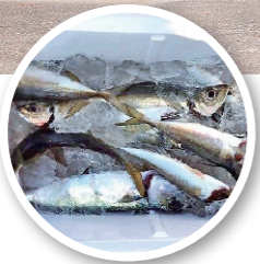
福山港周辺で釣れたアジ