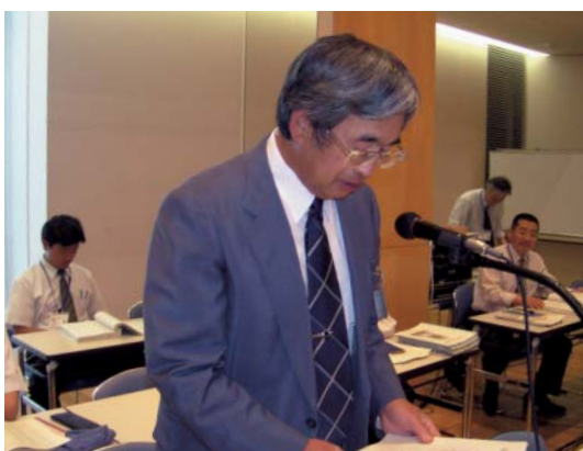
提案説明を行う岡元建設副部長（隼人町）