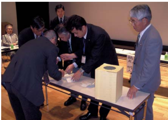
農業委員会委員の取扱いに係る無記名投票の開票風景