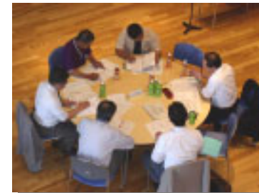
～ 社会基盤グループ～