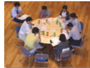
～ 教育文化グループ～