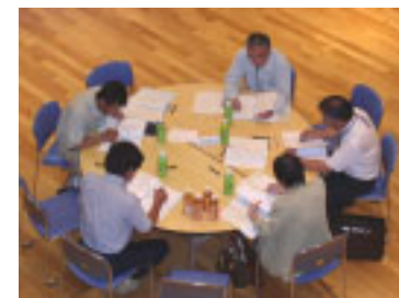
～ 産業経済グループ～