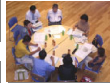
～ 生活環境グループ～