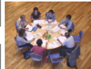
～ 保健福祉グループ～