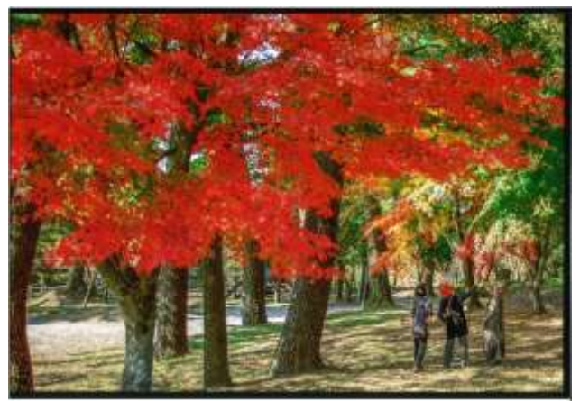
入選『炎 ほのお のような息吹 いぶき 』