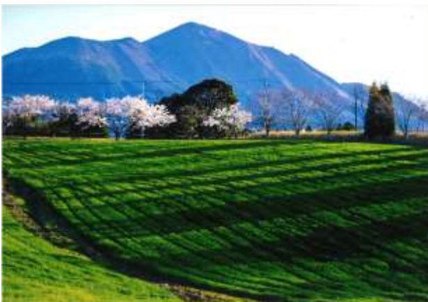
四季賞『春本番 はるほんばん 』