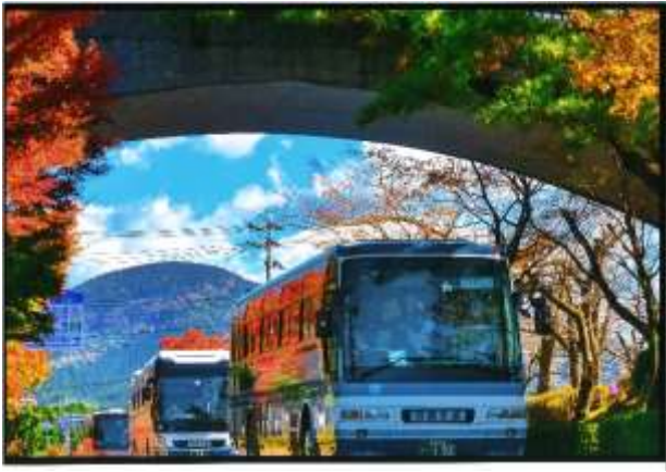
四季賞『霧島路 きりしまじ を行く ゆ 』