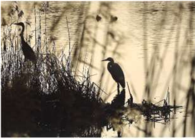
入選『 みまも 見守る』 久高 将文