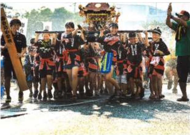
入選『僕等 ぼくら の夏 なつ 』