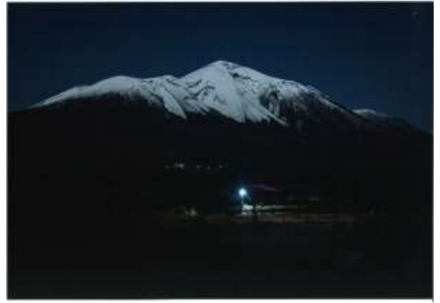
四季賞『浮かぶ霧島山 きりしまやま 』