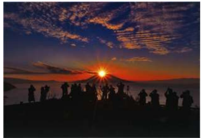
入選『 さくらじま ダイヤモンド ねら 桜島を狙って』 木之元 俊久