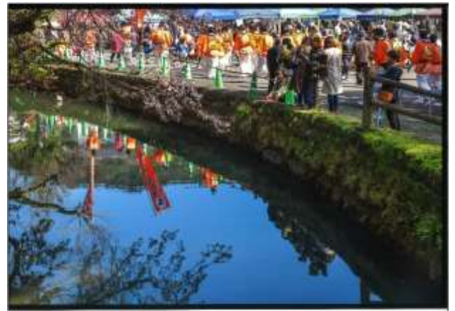
入選『 おど 踊りを お 終えて』