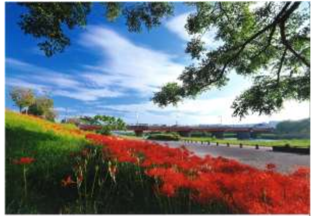
入選『 あかいろ 赤色の河道 かどう 』