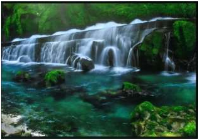
霧島市観光協会賞『静寂 せいじゃく の流 なが れ』