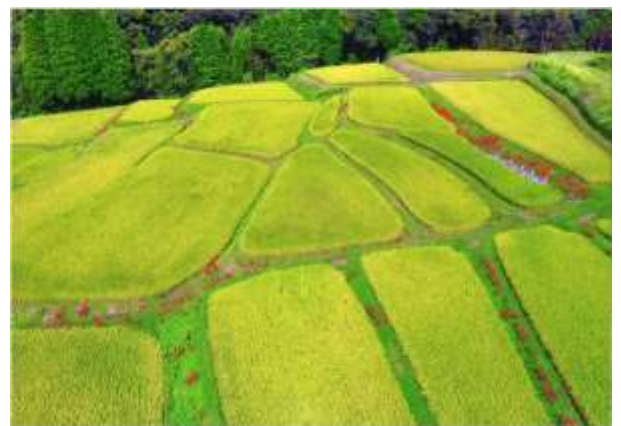
入選『 あきいろ 秋色の たなだ 棚田』