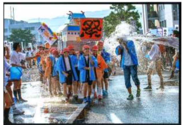
四季賞『水バズーカ みず 砲直撃 ほうちよくげき 』