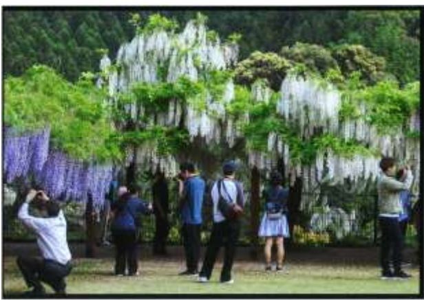
入選『 いま 今がシャッターチャンス』 梅木 トキエ