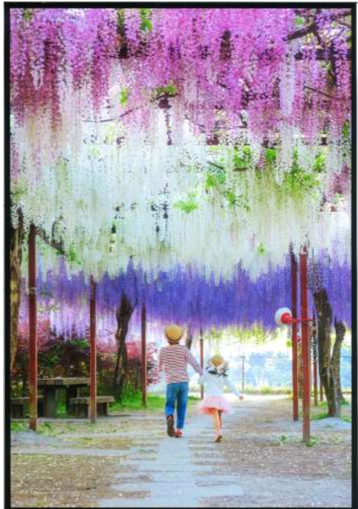
きりしま大賞『和気藤 わけふじ の誘い さそい 』