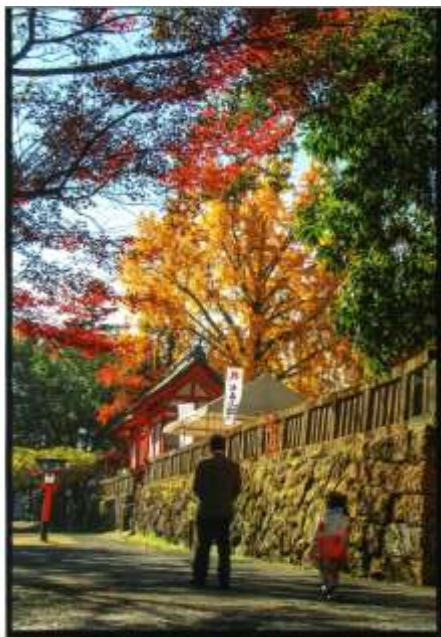
入選『 こうよう 紅葉の輝き かがや 』