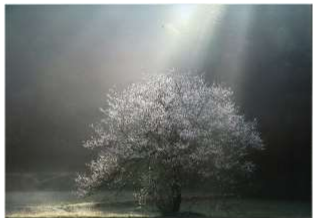
入選『 ばいか 梅花にスポットライト』 武田 敏文