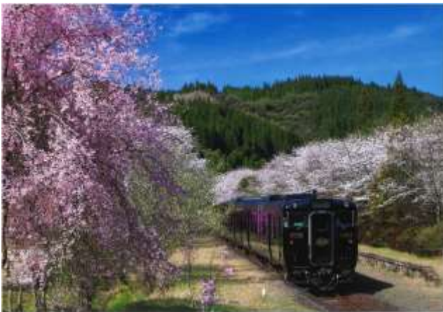
入選『 はる 春の えんせん ローカル沿線』 辻 典昭