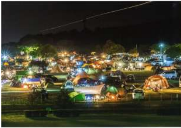
入選『 ひかり 光の饗宴 きょうえん 』