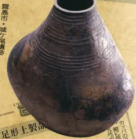
壺形土器 (城ヶ尾遺跡・霧島市) 【県指定文化財】