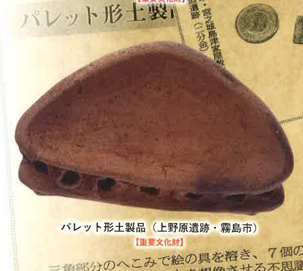
パレット形土製品 (上野原遺跡・霧島市) 【重要文化財】