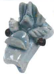
出水市・中郡遺跡 (随時掲載)