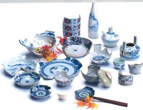
いちき串木野市・柞城跡(随時掲載)

串木野郷を治めた郷土屋敷跡から、有田焼などの器が見つかりました。染め付けの青や赤い色絵が鮮やかで、とっくりや「からから」(酒器)もあります。正月の宴を彩ったことでしょう。(県立埋蔵文化財センター)