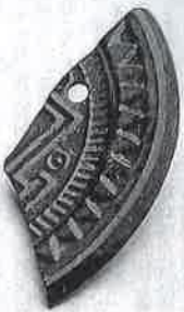
霧島市・本御遺跡