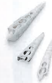
奄美市・下山田遺跡 (随時掲載)