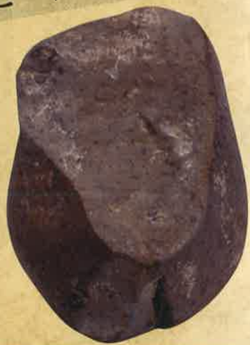
耳取ビーナス (桐木耳取遺跡・霧島市) 【県指定文化財】