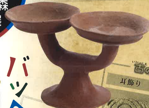
高環形土器 (南摺ヶ浜遺跡・指宿市) 【県指定文化財】