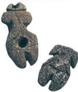
南さつま市・上加田遺跡(河ココレクション) (随時掲載)

加工しやすいため、軽制の岩偶です。子供の髪やあじよを折ったのとれまが、二人のさかさぎをを折まてくまじよか。(県立埋蔵文化財センター)