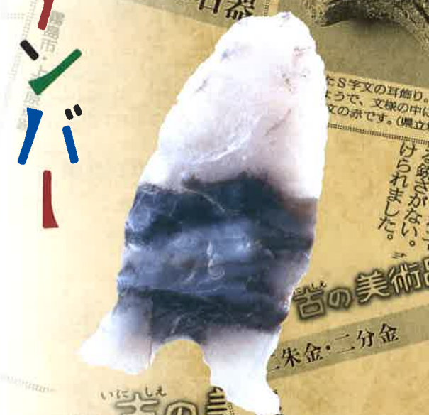
トロトロ石器 (上野原遺跡・霧島市) 【重要文化財】