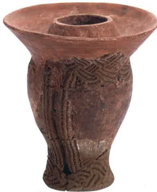
瀬戸内町・嘉徳遺跡(河ココレクション) || 随時掲載