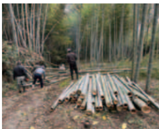
溝辺町竹子地区の竹林整備の様子

答 「農福連携」とは、障がい者等が農業分野で活躍することを通じ、自信や生きがいを持って社会参画を実現していく取組である。担い手不足や高齢化が進む農業分野において、新たな働き手の確保につながる可能性もある。生産者から障がい者などの雇用に関する相談があった場合は、農福連携の仕組や助成制度についての相談窓口を紹介することとしている。