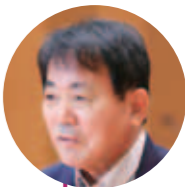
前川原 正人 議員

問 令和6年4月から会計年度任用職員に対する勤勉手当を夏冬ともに、1・025月支給するよう人事院が勧告した。勧告では俸給表が改正された場合、常勤職員と同様に4月に遡って支給することを通知しているが、どう対応するのか。