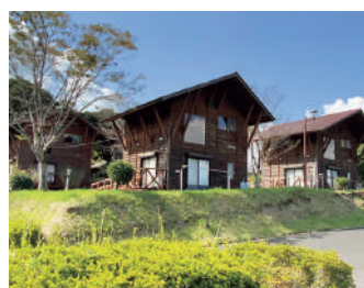
丸岡公園バンガロー「こもれびの里」

答 令和5年度から社会資本整備総合交付金などを活用したりリニューアルに取り組み、令和7年7月には「延長日本一」のゴーカート延伸工事を完了し、利用者に好評である。キャンプ場については設備や夜間の管理の都合上、整備は困難であるため、既存のバンガローなどを利用してほしい。