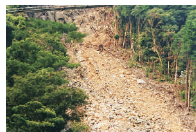
敷根赤川地区のかけ崩れ

答 こども館の敷地内や周辺道路等が被災し、利用者の安全のため、8日から12日まで休館した。被災状況を確認し、立入禁止区域を設けることで入館者の安全を確保できると判断し、13日からの開館を決定した。今後も委託業者との連携を密にし、状況に応じて臨時休館など必要な対策を講じる。