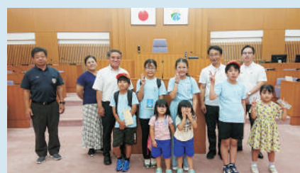
6組19名の参加がありました