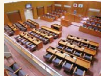
3月定例会は、延べ43名の方が傍聴されました

6月定例会は、6月2日(金)に開会予定です。傍聴の手続きは、議会棟4階にて「傍聴人受付簿」に住所と名前を書き添付してください。お気軽にお越しください。ご不明な点は、議会事務局(64-0922)へお問い合わせください。