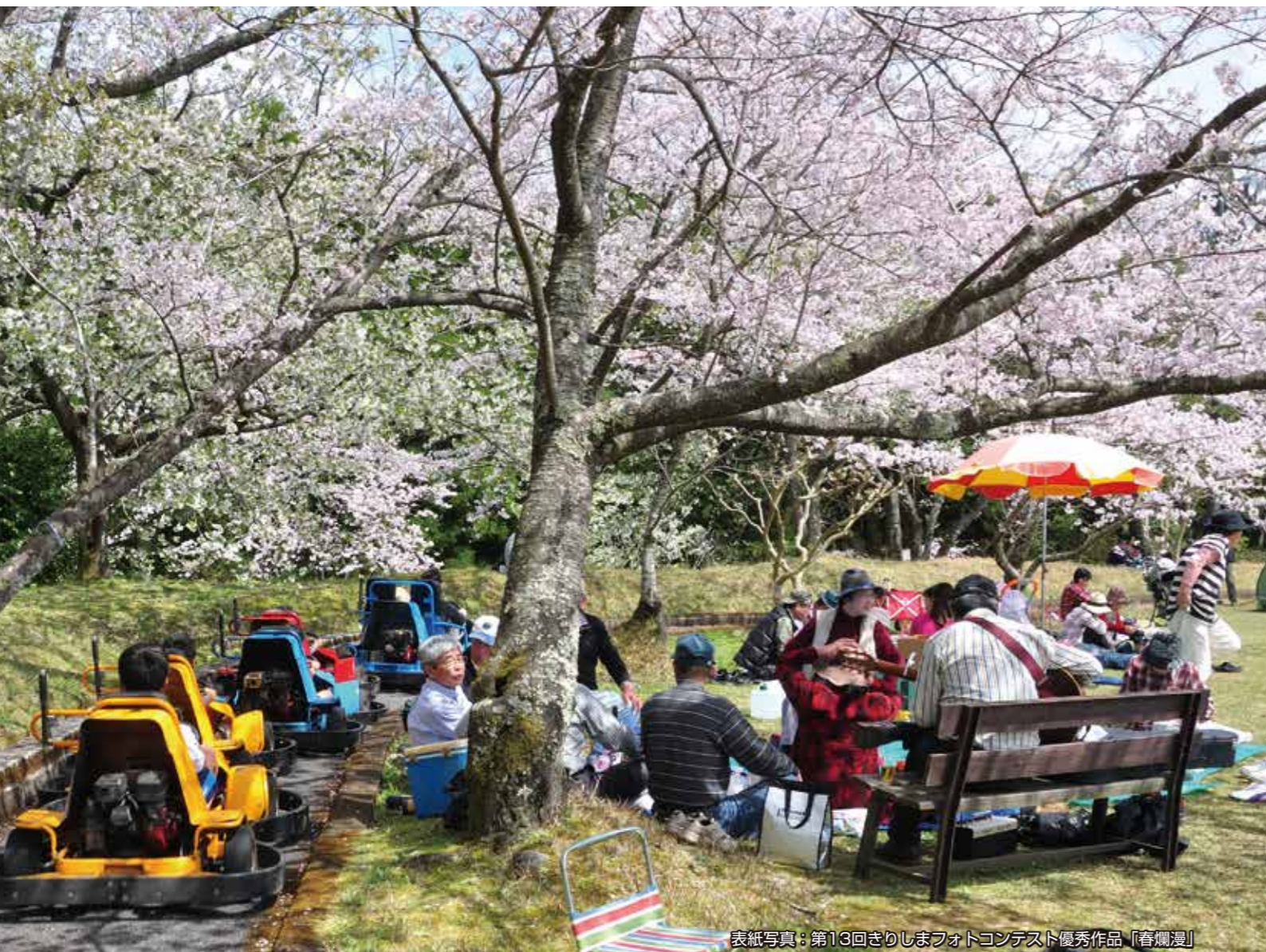
表紙写真：第13回きりしまフォトコンテスト優秀作品「春爛漫」

発行：霧島市議会 編集：広報広聴常任委員会 〒989-4394 鹿児島県霧島市国分中央三丁目45番1号 TEL:0995(64-0922) FAX:0995(64-0923) 霧島市議会URL: https://www.city-irisaki.jp/hisyo/okouhou/shisei/shigikai/index.html 霧島市議会Eメール: gihai@city-irisaki.jp