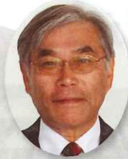
議長 常盤 信一