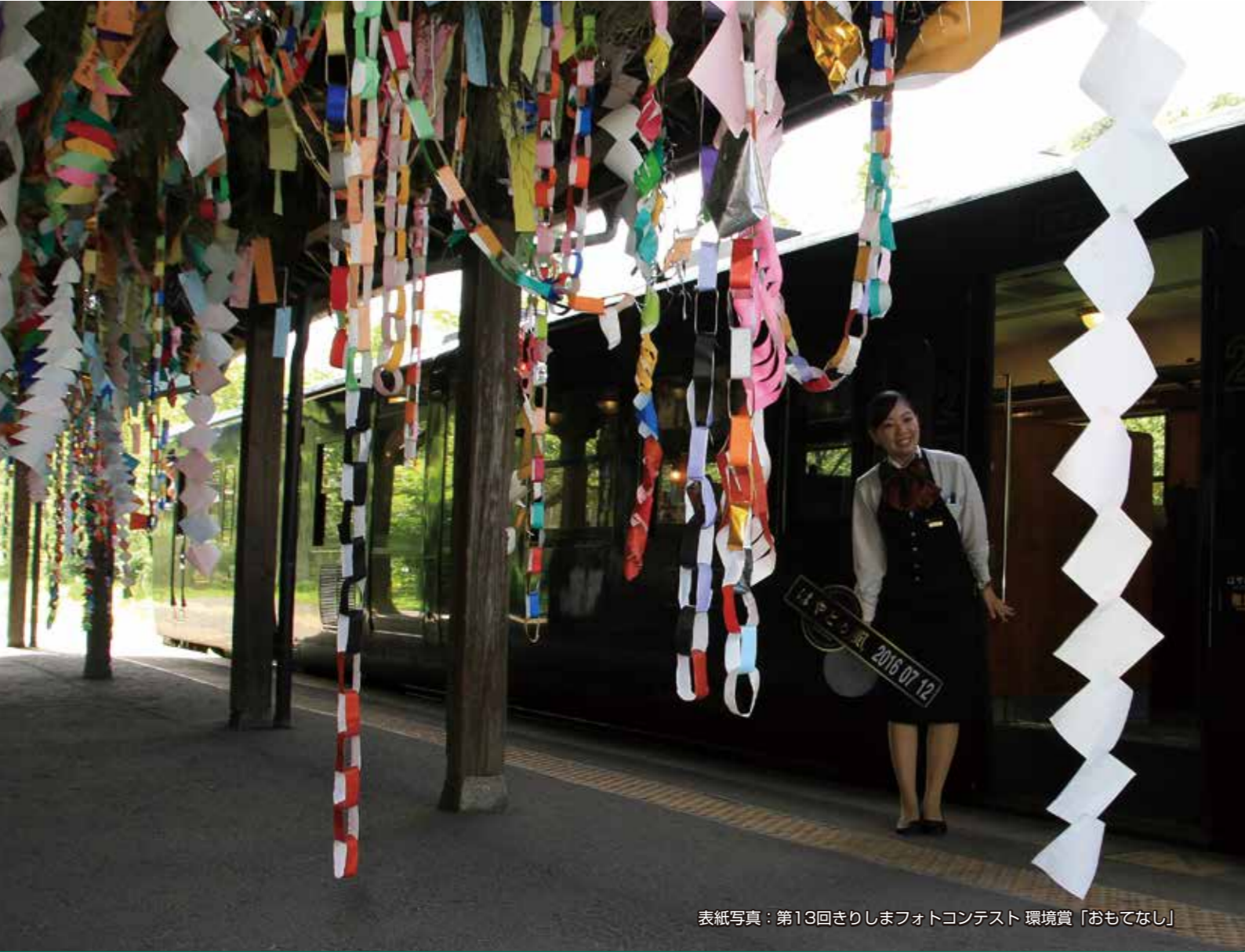
表紙写真：第13回きりしまフォトコンテスト 環境賞「おもてなし」

発行：霧島市議会 編集：広報広聴常任委員会 〒899-4344 鹿児島県霧島市南中央三丁目4番1号 TEL(0995)64-0922 FAX(0995)64-0923 霧島市議会URL https://www.city-kirisima.jp/isyokouhou/hiseishingikai/index.html 霧島市議会Eメールアドレス gihai@city-kirisima.jp