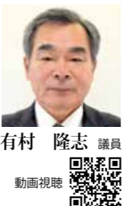
議員 有村 隆志 動画視聴

問 幼児教育を無償化し、育児世帯の負担軽減を図り、質の高い教育の推進と将来の貧困対策や子育て世帯の定住促進に活かせないか。