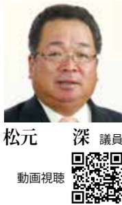
議員 深 元 松 動画視聴