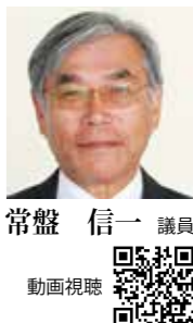
議員 常盤 信一 動画視聴