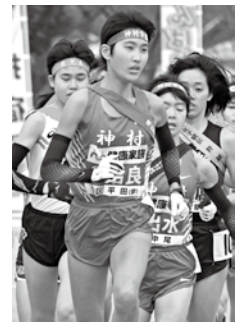
昨年、優勝した始良チームの選手たち