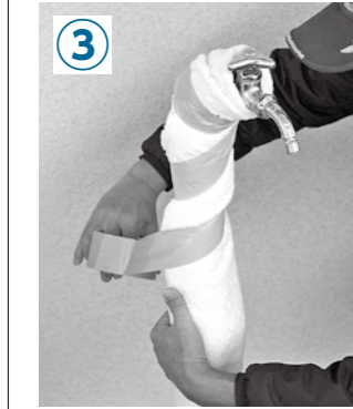
上から布テープなどで縛り、固定すれば完成。