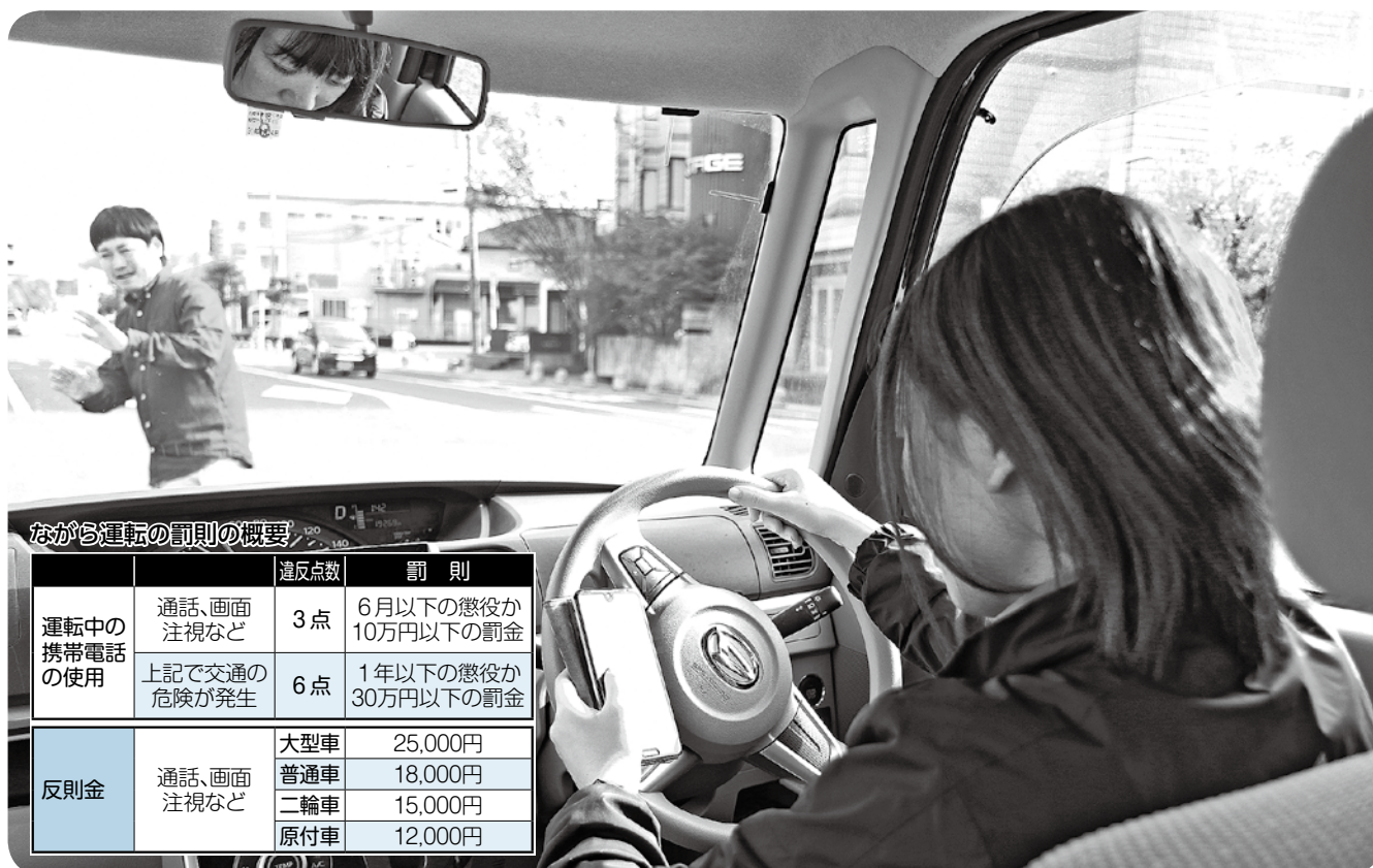
ながら運転の罰則の概要