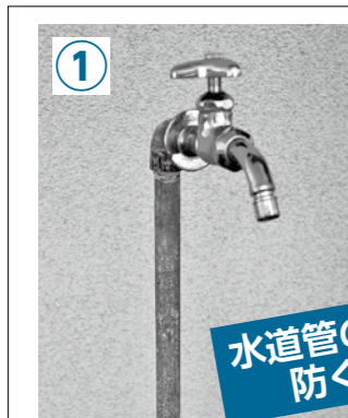
むき出しの水道管。