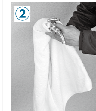
タオルなどの厚手の布を水道管に巻き付ける。