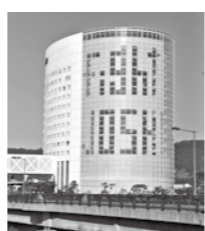
ホテル京セラも応援