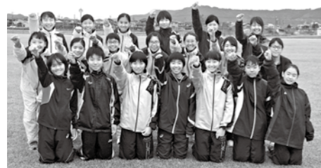
今回、合同練習に参加した選手たち