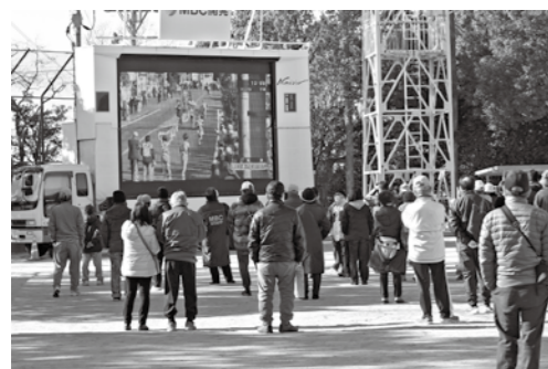
固唾をのんで見守る観客たち