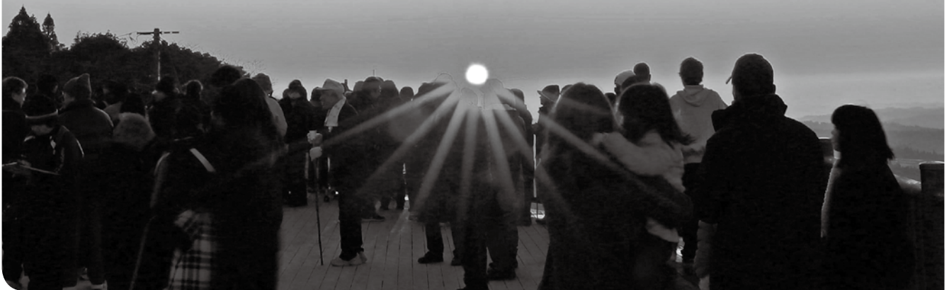
惣陣が丘展望所での初日の出