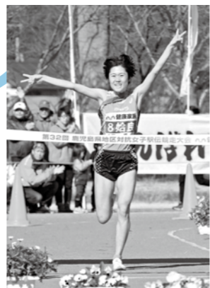
前回の優勝の瞬間