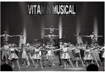
昨年の公演の様子

大正時代に建てられ、県の有形文化財でもある旧田中家別邸。日本庭園に咲くオキナグサを眺めながら、ゴッタン演奏や福山小学校児童の合唱などを楽しみませんか。黒酢の試飲もあります。 ●日時 3月14日(土)午後1時～3時