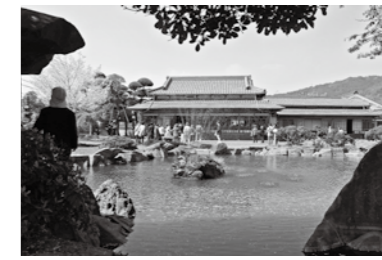
旧田中家別邸の日本庭園

●申し込み先 エコミュージアム福山(池江) ☎(99)090(9728) 1760