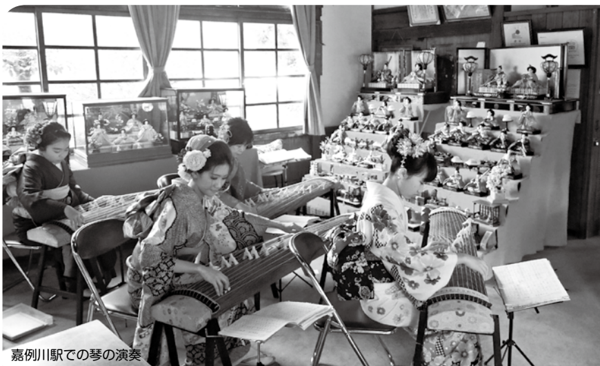
嘉例川駅での琴の演奏