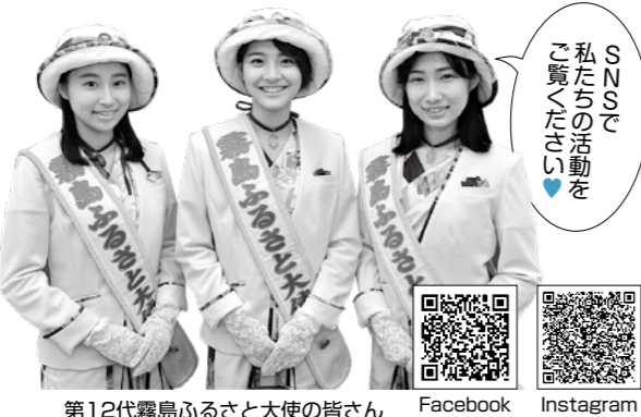
第12代霧島ふるさと大使の皆さん

応募期間 3月2日(月)～4月30日(木) 霧島国分夏まつり(7月18日)から1年間、霧島市の魅力を国内外にPRするため、市内の各種イベント、東京、大阪、福岡などである観光宣伝や物産展、姉妹都市交流行事などに参加していただきます。 たくさんの出会いもあり、貴重な経験を積むことができます。ぜひ、ご応募ください。