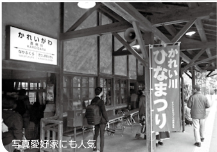
写真愛好家にも人気