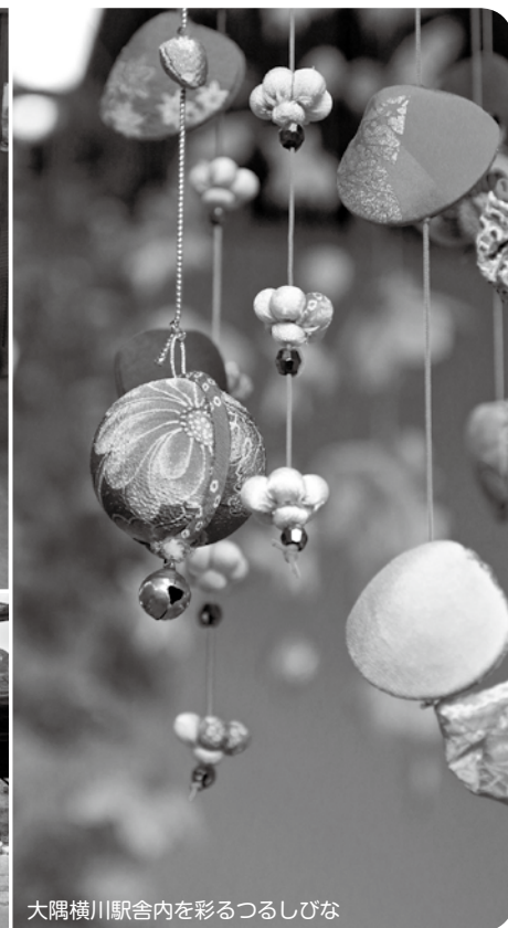
大隅横川駅舎内を彩るつるしびな