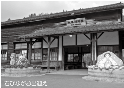
石びながお出迎え