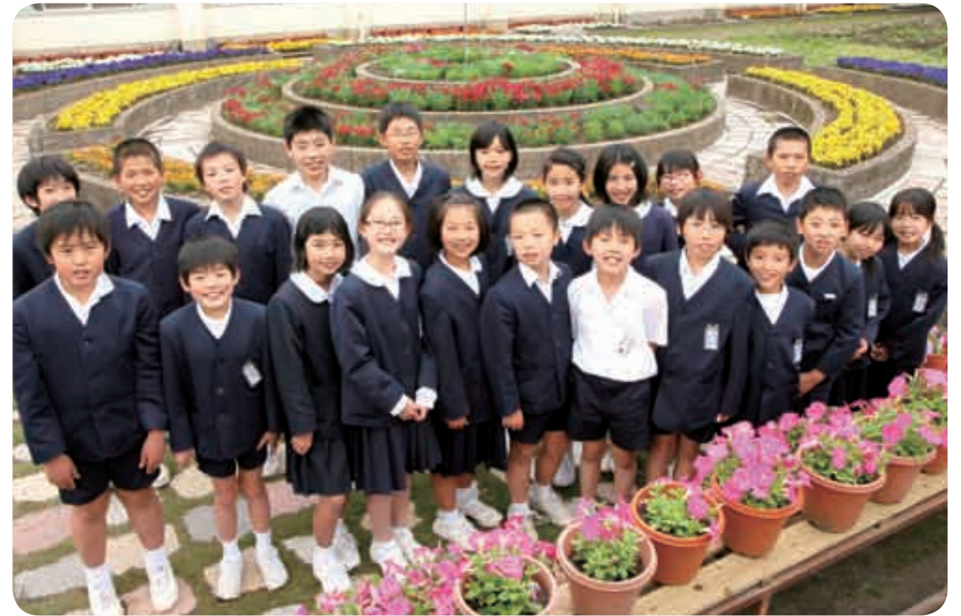
花の栽培に積極的に取り組む栽培委員会の皆さん

国分小学校は、児童数726人(男子371人、女子355人)で、創立136周年を迎える伝統ある学校です。もともと舞鶴城があったこの場所には今も石垣や堀が残り、当時の姿を偲ばせています。同校は保健、給食に力を入れており、2年連続で県学校保健優良学校賞、県学校給食準優良学校賞を受賞しています。また、吹奏楽部の活動が盛んで、平成20年には日本管楽合奏コンテストで最優秀賞を受賞しました。