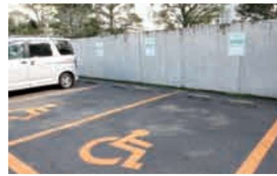
パーキングパーミット制度専用駐車場