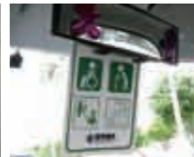
ルームミラーに利用証を掲示