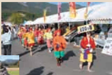
田の神さあおどり大会 神官型の田の神さあ

えびの市では、ふるさとに生きつづけている生活文化やふるさとを支えている産業を広く知ってもらい、ふるさとのよさを再確認してもらうために、田の神さあの里産業文化祭を行っています。その中で1年間の豊作に感謝を込めて、人々が田の神さあの格好をし、踊り練り歩く催しも行っています。