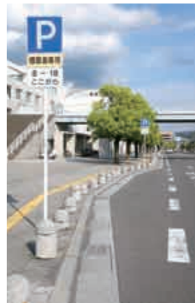
高齢運転者等専用駐車区間 霧島市国分シビックセンター前