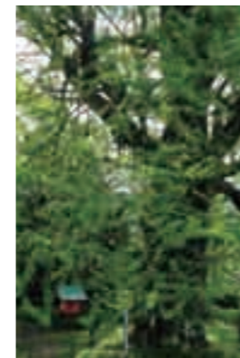
御神木(福山) 4月18日 午前9時12分

※読者プレゼントを提供して下さる方を募集しています。秘書広報課広報広聴グループ ☎(64) 0955 までご連絡ください。