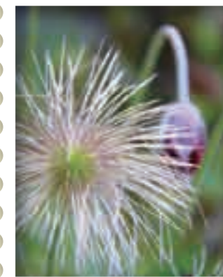
オキナグサ(翁草) キンボウゲ科