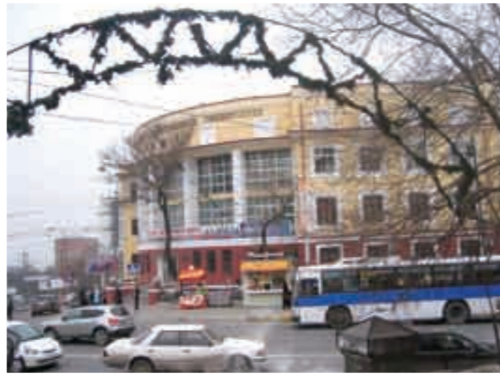
ウラジオストクにあるロシア国立極東大学(URFU)の日本センター

結婚を機に霧島に移り住んで2年。北国新潟で生まれ育った私が、南国鹿児島で暮らすことになるのは、夢にも思っていませんでした。結婚前は京都に住み、歴史研究者としての道を歩み始めていました。専門は日露交流