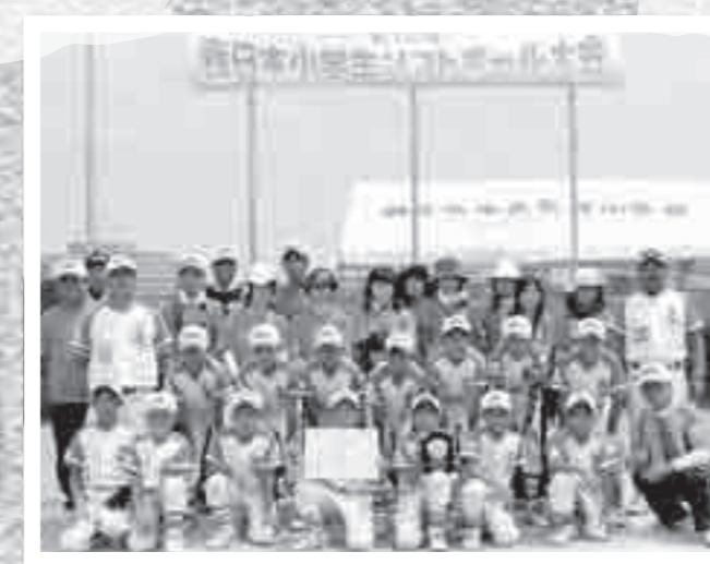
富隈ソフトボールスポーツ少年団が第12回西日本小学生ソフトボール大会で3位に入賞