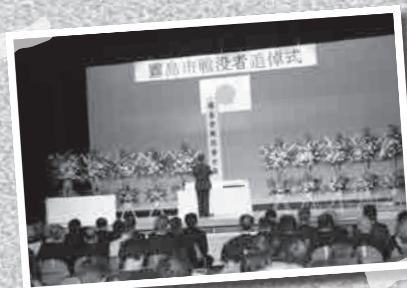
霧島市戦没者追悼式が8月3日、隼人町農村環境改善センターであり、戦没者の御霊を慰めました