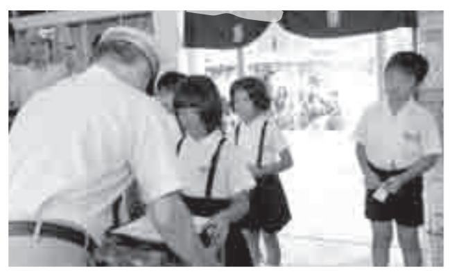
大田小学校の児童が8月2日、霧島地区の駅や総合支所などにスズムシをプレゼント