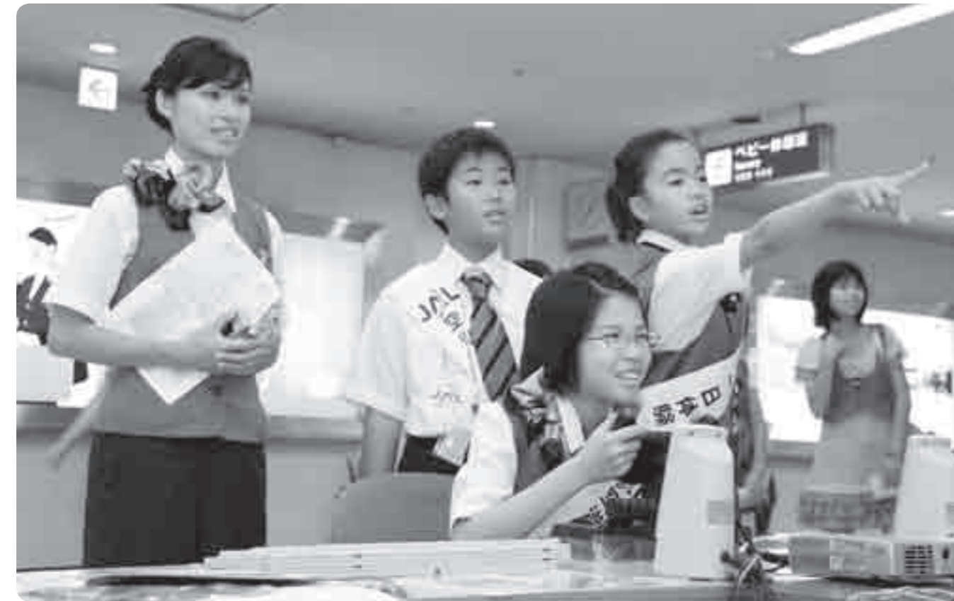
昨年の空の日フェスティバルの様子