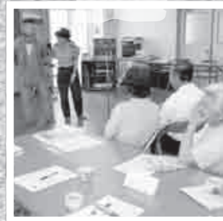
福山町 こめぐり 廻地区公民館で7月23日、霧島警察署職員が寸劇を交え、振り込め詐欺への注意を呼びかけました