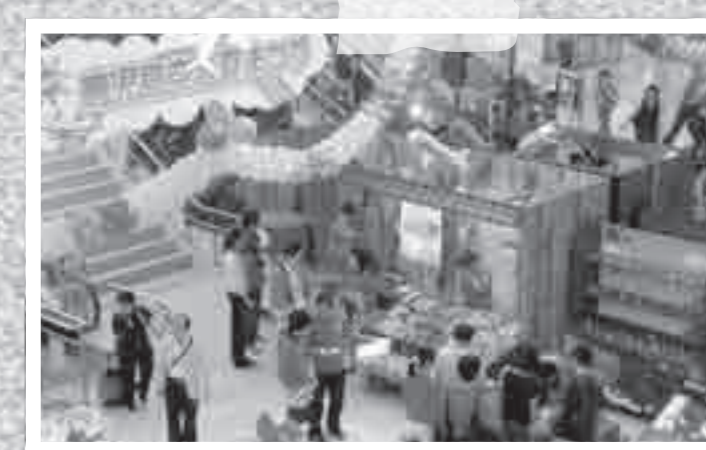
鹿児島空港夏祭りが7月31日と8月1日の2日間開催され、多くの家族連れでにぎわいました