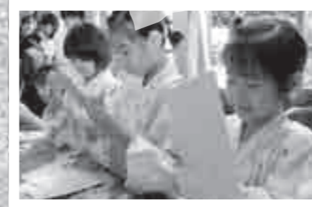
中福良小学校の児童が7月24日、嘉例川駅で風鈴作りを体験