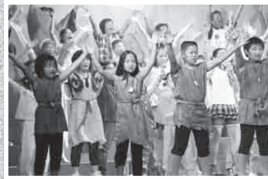
市民参加型ミュージカル「ひかるの夏2010」が8月8日に開催され、超満員の観客からは大きな拍手が送られました