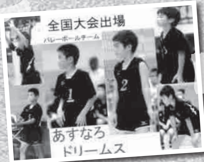
隼人地区のバレーボールスポーツ少年団あすなるドリームスが、第30回記念全日本バレーボール小学生大会に出場