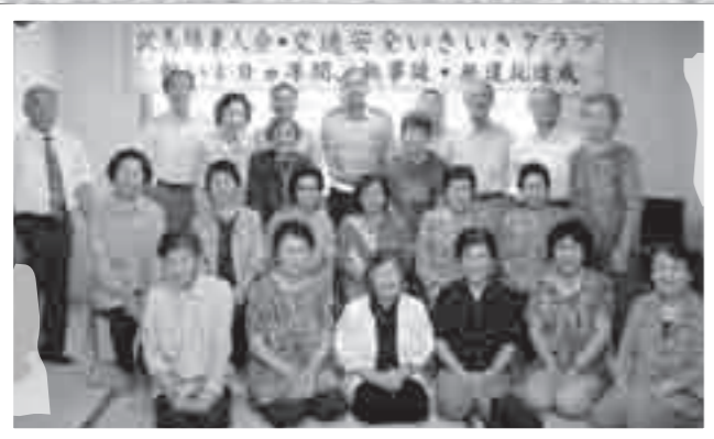
隼人地区の沢馬場老人会でつくる交通安全いきいきクラブの会員全員が、10年間無事故・無違反を達成