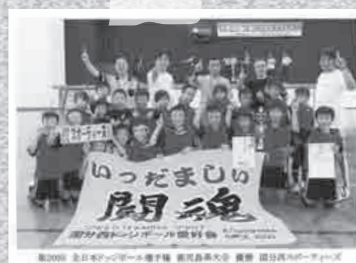
国分西スポーツが全日本ドッジボール選手権鹿児島県予選で見事、優勝