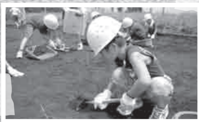
発掘調査体験が8月3日に行われ、応募のあった市内の子どもたちが遺跡の発掘に挑戦