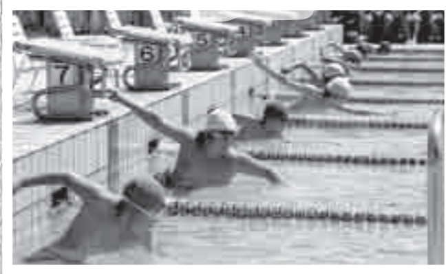
霧島市小学校水泳記録会が7月22日、国分総合プールで開催されました