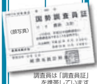
調査員は「調査員証」を携帯しています