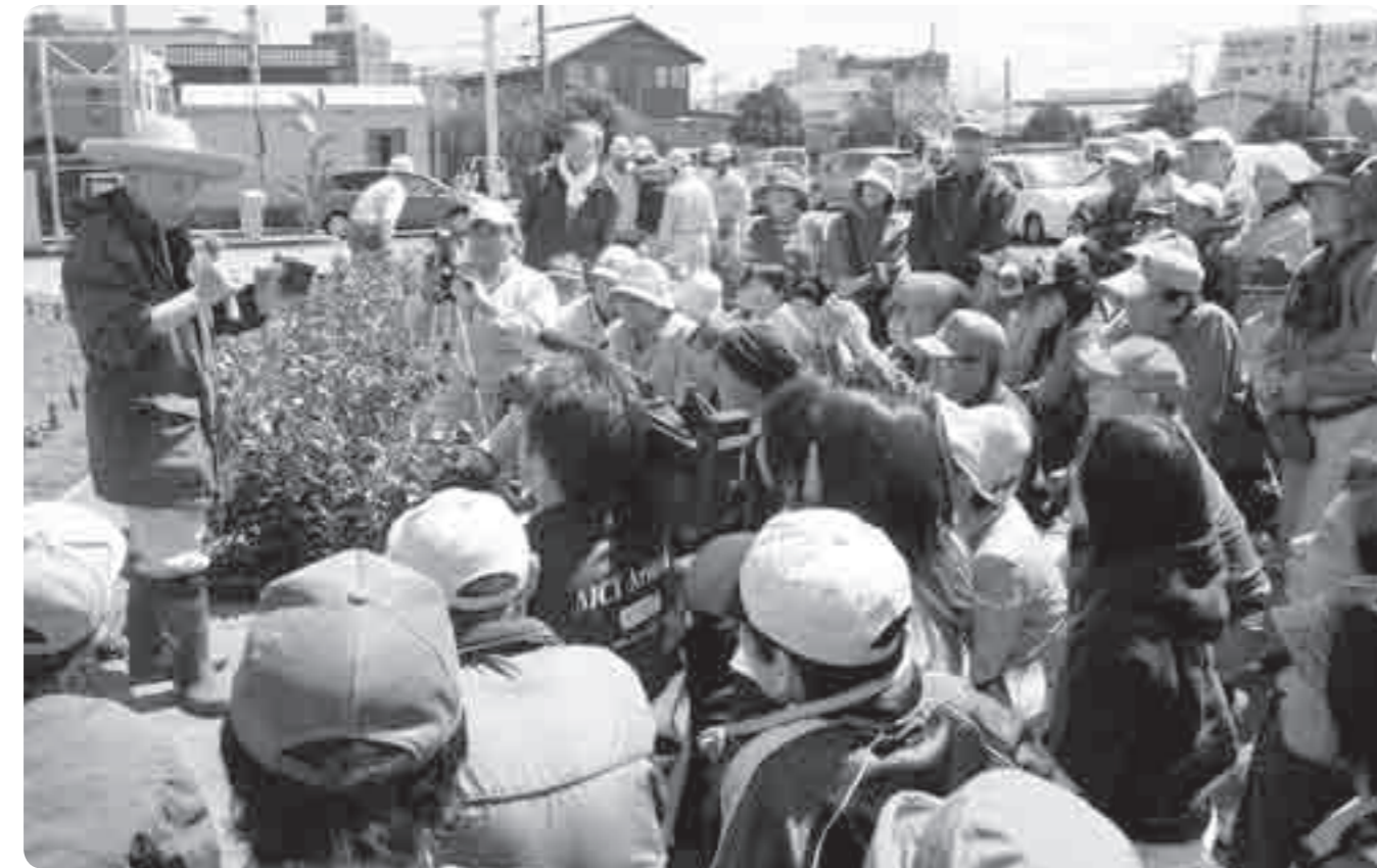
宮脇昭先生から植栽の指導を受ける参加者 (平成21年3月)