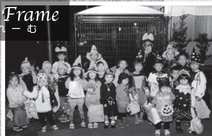
横川町第3今村住宅自治会がハロウィンパーティーを10月31日に開催。25人の子どもたちが仮装して地区内を回りました。