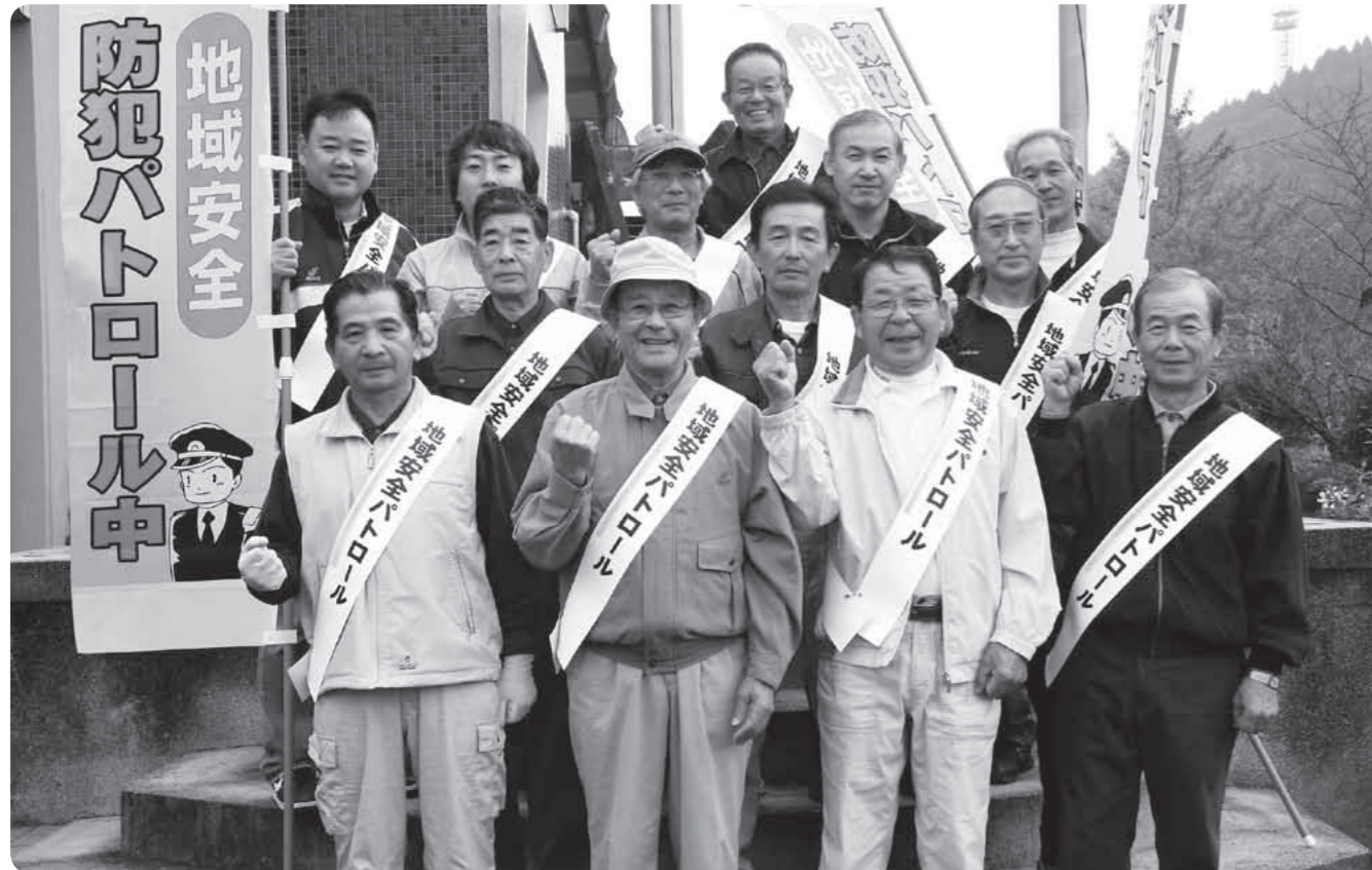
今年9月に結成された霧島地区の待せ(まつせ)自治会防犯パトロール隊