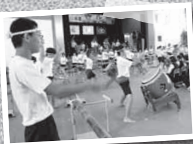
10月30日、牧園中学校の文化祭で3年生全生徒64人が霧島九面太鼓を披露しました。