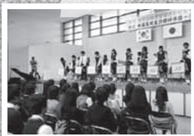
韓国の高校生が11月1日、鹿児島第一高校を訪問。音楽やスポーツを通して交流を深めました。