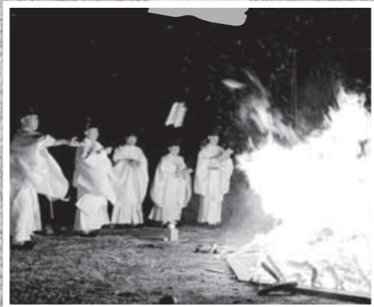
天孫降臨御神火祭が11月10日、霧島神宮古宮址で開かれました。