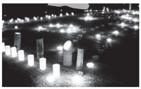
霧島地区堀之内自治会が11月7日、十五夜秋まつりを開催。みんなで作った竹灯ろうなど700本が地域を彩りました。