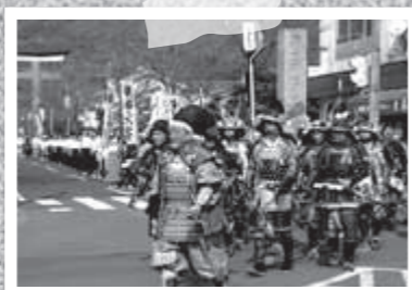
10月17日に開催された浜下り。約350人の武者行列などが練り歩きました。