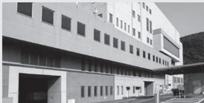
年末年始のごみ処理施設の休業期間