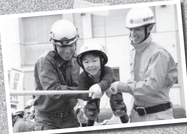
11月7日、消防局で防災フェスタが開かれ、子どもたちがレスキュー訓練などを体験しました。