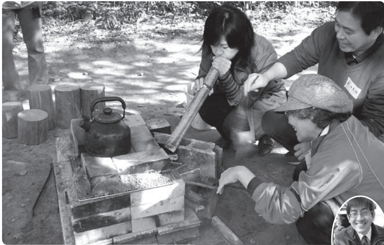
2月7日に行われたモニターツアーでピザ作りに挑戦する参加者