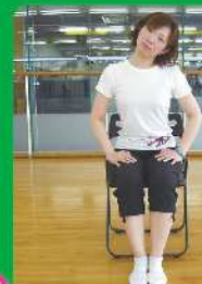
2 頭を左右に倒します