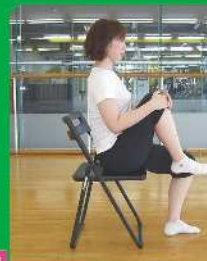
5 膝を胸に近づける