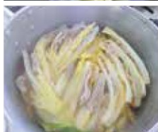
▲鍋に敷き詰め煮る