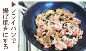
▶フライパンで揚げ焼きにする