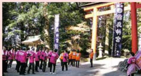
踊り奉納（豊年まつり）