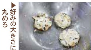
▶好みの大きさに丸める