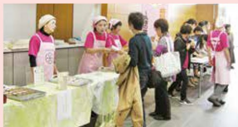
試食のふるまい（市民健康講座）