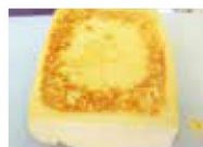
▲表面に焦げ目をつける