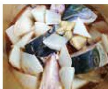
▲アクを取りのぞき、 中火で煮る