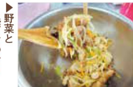
▶野菜と混ぜ合わせる