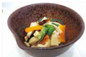
▲できあがり～高齢者向けに食べやすく～