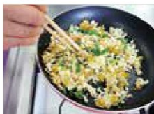
▲フライパンで炒める