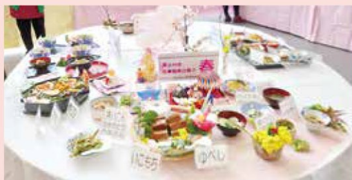
郷土食展示（健康福祉まつり）