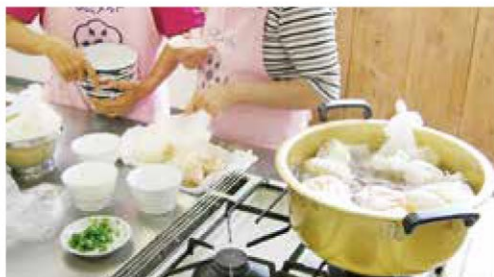
パッククッキング