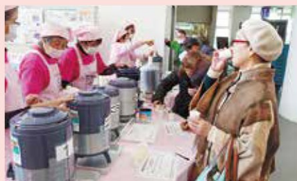
味噌汁試飲で味覚チェック （健康福祉まつり）