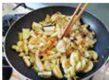
▲フライパンで炒める