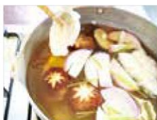
▲小分けにしている