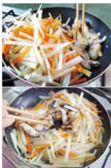
▲さばの身が崩れすぎないように炒める