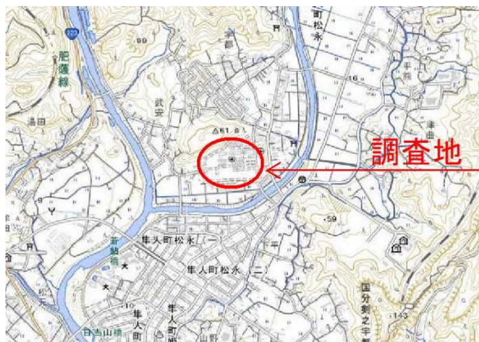
図-1 調査地案内図