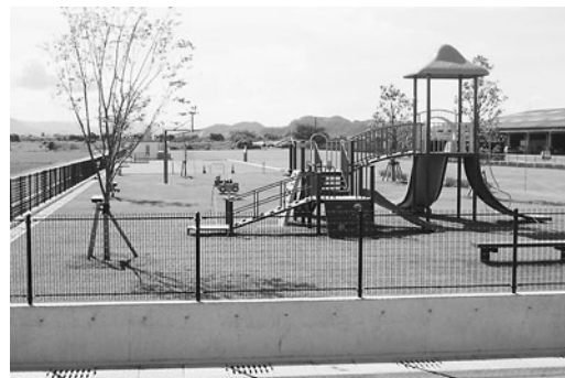
広瀬地区コミュニティ広場