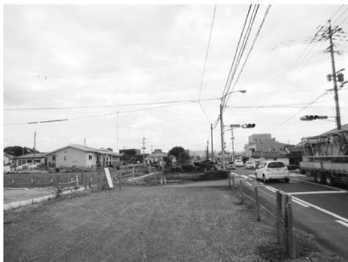
浜之市土地区画整理事業（国道10号沿）