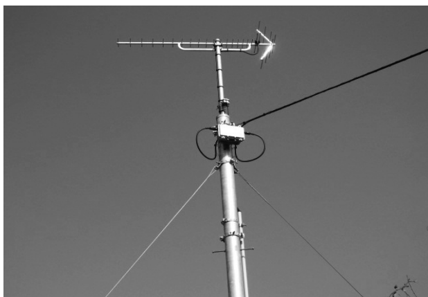
地上デジタル放送共聴施設受信アンテナ

○インターネットや携帯電話などによる情報提供、情報の双方向性を活用した情報の共有化を図るとともに、これらを活用した地域課題の解決に向けた取組を支援します。