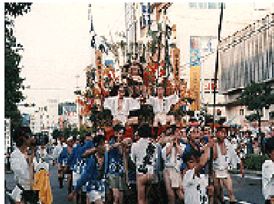
霧島国分夏まつり 総踊り風景 ▲ お問い合わせ：霧島市商工会議所 TEL：0995-45-0313

昨年の隣県で発生した口蹄疫のため、中止となった『霧島国分夏まつり』が、7月16日(土)・17日(日)の両日、国分シビックセンターを中心に周辺市街地で2年ぶりに開催されます。初日の市中パレードに始まり約6000人の総踊り、二日目の国分寺御輿競走でフィナーレを迎えます。祭り期間中は、市内外から約14万人の人出で賑わいます。