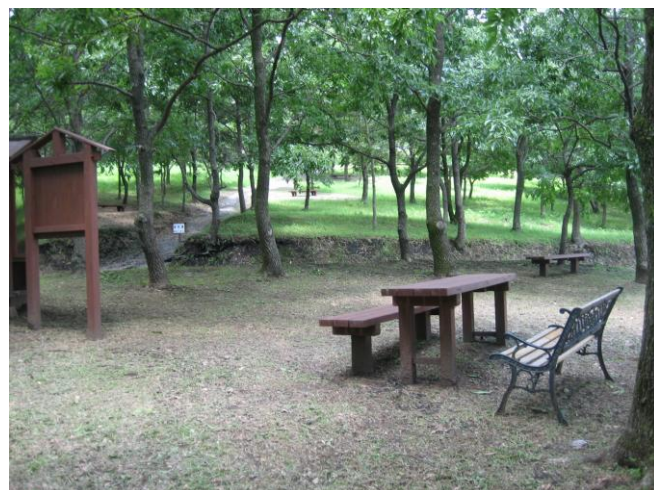
▲ 関平温泉前の遊歩道入口付近、距離＝往復約400m

関平温泉に来られたお客さまが、温泉の森の木陰でお弁当を広げる風景が時々見受けられましたので、この度、休憩用のベンチも設置して、これまであった遊歩道も散策できるようになりました。天気の良い日は散策したり、お弁当も食べられます。沢山の方が気軽に森を楽しんで頂けたらと思います。