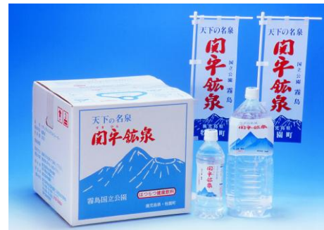
鉱泉水価格 (税込・送料別)

お中元のシーズンです。お中元の品は、もうお決めになりましたでしょうか。「お世話になったあの方に・・・いつまでも健康であってほしいあの方に・・・」あなたの感謝と願いを込めて、関平鉱泉を是非お使いください。