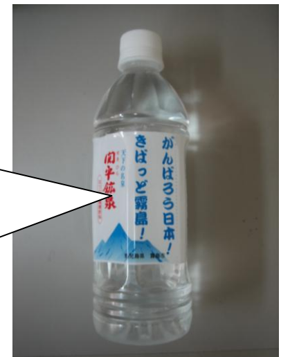
▲ 新500mlペットボトル「きばっと」＝鹿児島弁でがんばろう