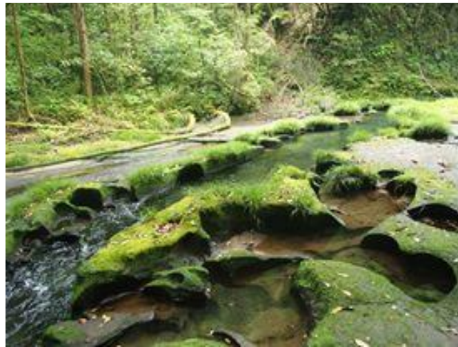
▲ 天降川の流によって回転する小石が、長い年月をかけて硬い岩盤に穴をあけてきたという罅穴群

平成25年3月27日、「天降川流域の火砕流堆積物」が、国の天然記念物に指定されました。霧島市の国指定天然記念物は、えびの高原の「ノカイドウ自生地」に次いで2件目です。指定された場所は、JR嘉例川駅近くの天降川流域です。指定された理由は、水力発電用の水利用のため川底が表れている流域が、加久藤(かくとう)カルデラ(えびの盆地・約30万年前)と阿多(あた)カルデラ(指宿地域・約10万年前)と始良(あいら)カルデラ(錦江湾・約2万9000年前)の噴出火砕流が連なって露出しており、地質学的に大変貴重な地域であり、軟弱な岩石が流水で回転した軽石などに削られて穴ができ、さまざまな罅穴(おうけつ)を作り出しているからです。また、水質の良い清流にしか生息しない「カワゴケソウ」も自生しています。