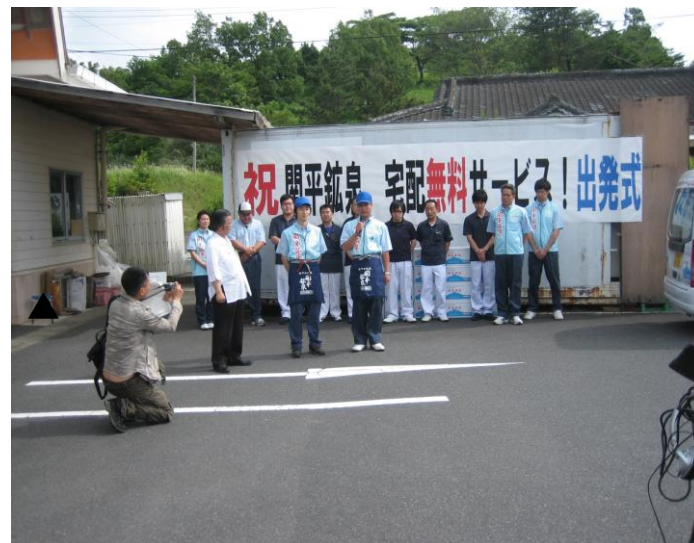
▲ 関平鉱泉販売所 霧島市内宅配無料サービス出発式風景 5/27(月)

以前、関平鉱泉所のドライブスルーに来るお客様の年齢構成をアンケート調査したところ、62%の方々が60歳以上と高齢者のユーザーが多いという特徴がありました。アンケート調査の際、「長年関平鉱泉水を飲んでいるが、20Lは重く持てなくなりました。」「車に乗れなくなり買いに行けなくなりました。」というご意見