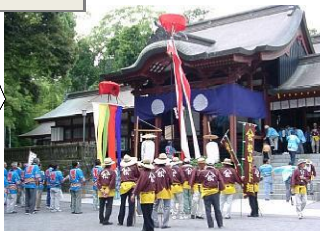
▲ 鹿児島神宮本殿 トド組による田植え歌の奉納

日時：6月16日(日)13時～ 場所：鹿児島神宮 雨天決行・無料 お問い合わせ：鹿児島神宮