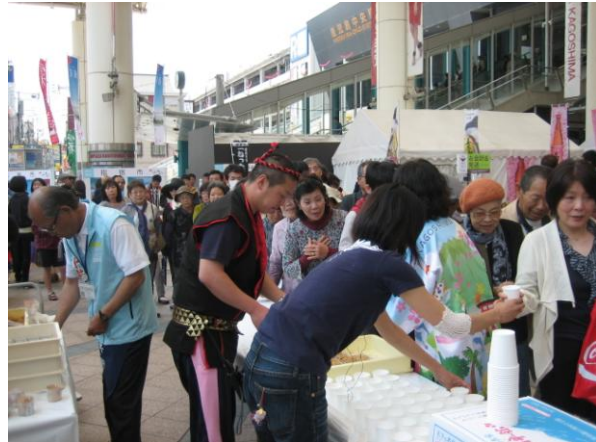
▲ 霧島市の観光課による鹿児島の郷土菓子“ねったぼ”の振る舞いと関平鉱泉水の試飲は大好評でした!!

鹿児島の特産品販売・観光情報紹介・県内17蔵元の焼酎試飲&即売会を行う「風土ピアかごしま2013」が5月3日(金)・4日(土)の2日間、鹿児島中央駅アミュ広場にて開催されました。当日は、関平鉱泉水をもっと知ってもらおうと試飲・販売ブースを設置して関平鉱泉水をPRしました。