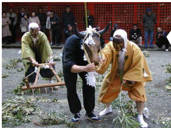
▲ 田の神まつり=平成3年3月15日、県無形民俗文化財に指定。ユーモラスな農耕劇は思わず笑ってしまうほど愉快です。

ここ霧島市では、梅雨に入ると一斉に田植えが行われます。鹿児島県地方は5月27日(月)梅雨入りし、通勤途中に田んぼに水がはられた風景を見かけるようになりました。霧島神宮や鹿児島神宮では、毎年6月上旬から中旬にかけて、これから斎田に植える稲穂が荒天や害虫などの被害にあわず、実りの秋を迎えて無事に収穫されるように祭典(御田植祭)が、今でもおごそかに行なわれています。