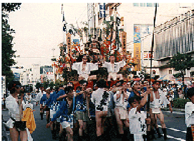
▲ 霧島国分夏まつり 総踊り風景 お問い合わせ：霧島市商工会議所 TEL：0995-45-0313

梅雨が明ければ、いよいよ夏本番。海やプール、そして山などアウトドア派の心はずむ季節です。7月の霧島市はイベントが盛りだくさんです。海水浴シーズン本番を前に毎年約5万人が海水浴に訪れる国分キャンプ海水浴場では毎年7月第1土曜日に安全を祈願する海開き式が行われ、ビーチは海水浴や磯遊びをする行楽客で賑わいはじめます。