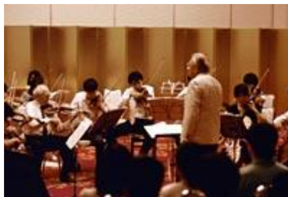
▲ 霧島国際音楽祭 お問い合わせ：みやまコンセール TEL：0995-78-8000

この国立公園霧島の地に集う国内外の音楽家たちにより、「第30回霧島国際音楽祭2009」が7月24日(金)、霧島市のみやまコンセールを主会場に開幕します。今年の音楽祭は8月9日(日)までに40回のコンサートや講習会があり、30回目を祝う企画も盛り込まれるほか、期間中はホテルロビーでも本格的なクラシックの調べを堪能することができます。あなたもしっとりと音色とともに霧島の夜を過ごしてみませんか。♪♪♪