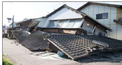
(熊本地震の被害状況)