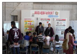
(防災フェスタの状況)