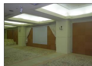
(耐震改修工事の事例)