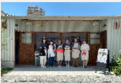
▲ママたちが主役のベーグル屋さん