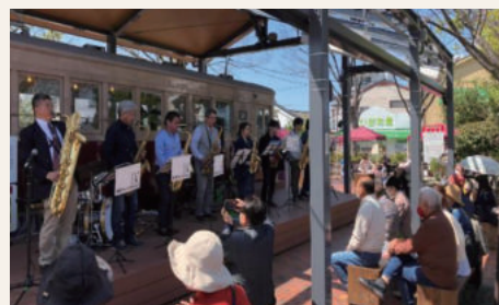
▲遊びがつながりを深くする

地域での遊びに触れる回数が多いほど幸福度が増す。そんな研究結果もある中、私たちは、ここ数年コロナウイルスの影響により、余暇や遊び、人との交流が断絶された社会を経験しました。これからの未来、仕事以外の時間の過ごし方が自由で楽しく、人や地域とのつながりをどうつくっていくか。皆さんと一緒に考えていきます！