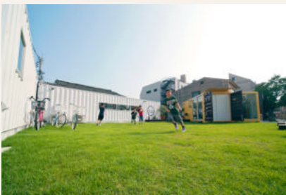
▲まちなかの「空き」を楽しむわいわいコンテナ

人口が減っていく時代において必要となるのは、あまり使われていない空間に新しい価値を見立てながら、みんなで楽しく使い倒すこと。空いている空間はポテンシャルだらけ！社会実験の仕掛け方から無理のない豊かな暮らしのつくり方まで、全国の事例を知りながら、自分のまちのポテンシャルはなにか、自分たちができないことはないか、妄想しよう！