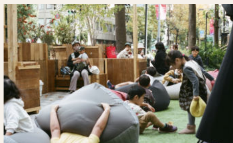
▲まちなかをリビングに

社会実験から日常へ。イベントを非日常の場として終わらせず、いかに地域の新しい日常につなげているか。池袋での取り組みを中心に、どのようにコミュニティが育まれ継続しているか、これから実践する方にヒントとなる事例が満載です！まちの日常をつくるのは地域に暮らす私たち！未来のために公共を育てていこう！