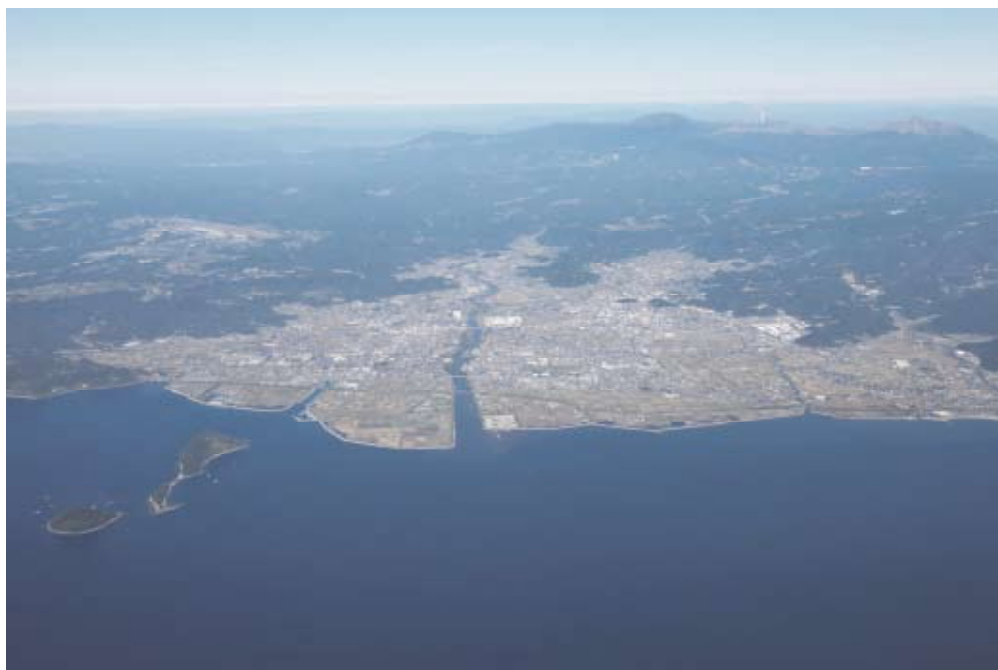
錦江湾上空からの霧島市

そのため、個性豊かな地域がそれぞれに輝きを放ちながら、それらが調和し、市全体として織りなすことにより、さらに美しく魅力ある霧島市ならではの景観形成を目指します。