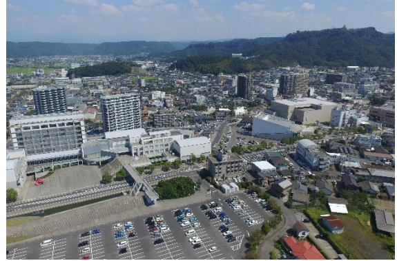
■ 中心市街地(国分シビックセンター周辺)