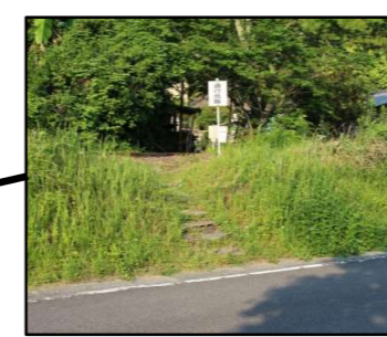
遮断機が無く、表示板が小さい 子どもが上りやすく列車と 接触の危険