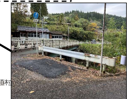
ゴミステーション跡地 ガードレールが低く転落の危険有