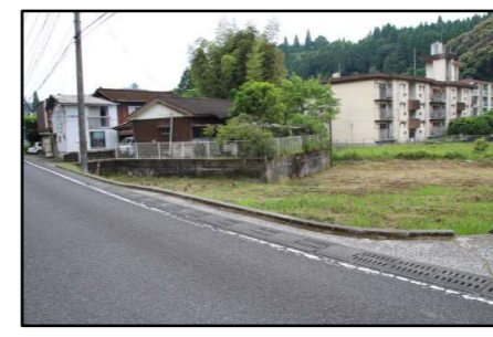
フェンスが無く転落の危険 また、見通しも悪い