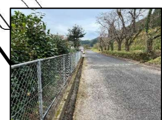
長安寮横側溝 排水が悪く大雨時に道路 と側溝の境目がわからなくなる