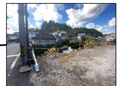
簡易的なバリケードで近づきやすく 転落の危険