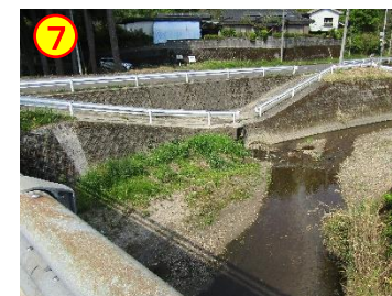
小原：あげち橋（馬渡川） 《川へ降りられる》