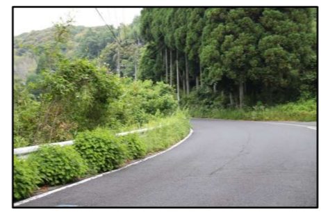
草が茂ると見通しが悪い