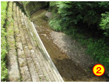
馬渡～前川内（馬渡川） 《川へ降りられる》