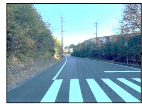
40km/m規制だが速度出しやすいので 追突しやすい