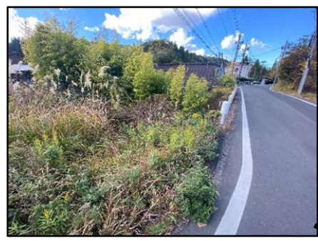
草が生い茂っており ガードレールが無く転落の危険