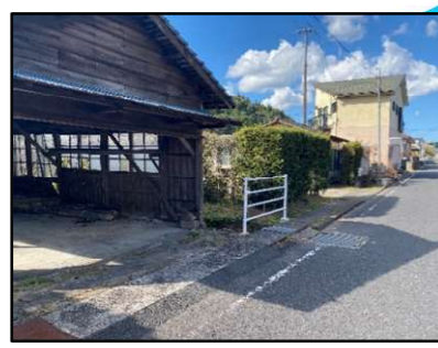
フェンス設置済みだが すき間があり転落の危険