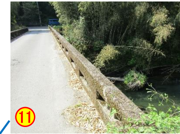
黒葛原：下原橋（金山川） 《欄干が低い》