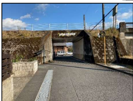
トンネル奥が見通し悪い 白線が見えにくいので危険