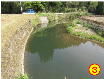
前川内～岩穴（久留味川） 《ガードレールがない》