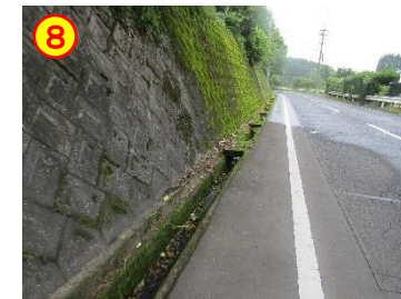
小原～赤水 周辺道路 《側溝のふたがない》