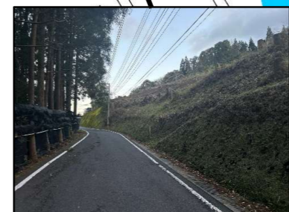
大雨時土砂崩れ注意!!