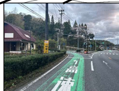
横断歩道や一時停止を無視 する車があるので注意!!