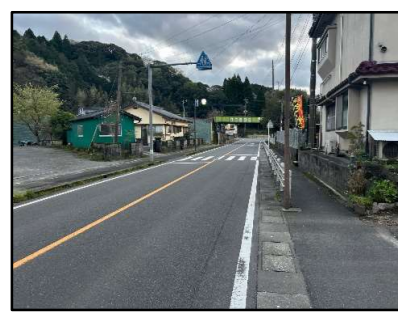
スピード超過車両多い。 横断歩道使用時は要注意!!