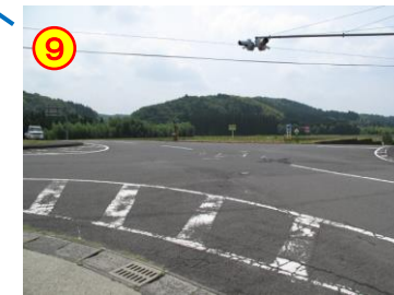
赤水交差点 《横断歩道がない》