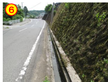
第3山住住宅 周辺道路 《側溝のふたがない》