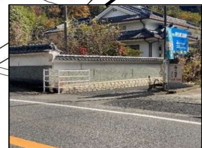
手前はフェンスがあるが 奥はないので転落の危険