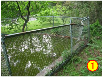
馬渡：貯水槽 《立入禁止区域》