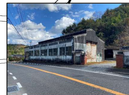
茶工場跡地 窓が割れやすく 通学時危険