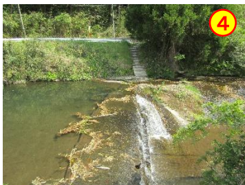
前川内～岩穴（久留味川） 《川へ降りられる》