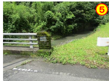
馬渡：馬渡橋（馬渡川） 《ガードレールの隙間が広い》