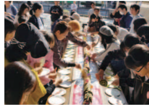
シティプロモーション推進事業 (霧島イイなの日)

A 各課お互いに情報を共有しながら、効果的なものを選択しながら取り組んでいきたい。