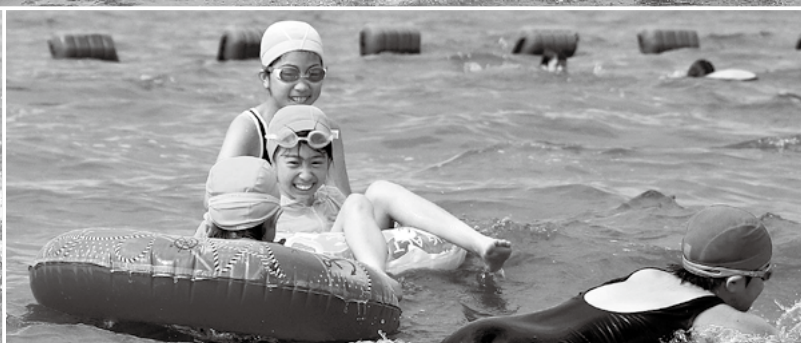
5年連続水質が最高ランクAAの国分キャンプ海水浴場ではしゃぐ子どもたち